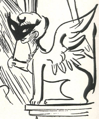
Christian Dior Masque de velours noir