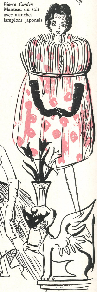
Pierre Cardin Manteau du soir avec manches lampions japonais