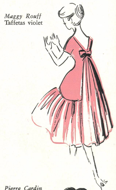
Maggy Rouff Taffetas violet

¿Llevará Vd. la falda más corta o más larga? Es el gusto personal de cada una el que lo decidirá, pero seguramente tendréis ese sombrero que encaje bien en la cabeza, ese cuello amplio que formará una corola por encima de los brazos, ese talle corto, ese movimiento hacia delante, ese estilo despojado de niña friolera. La genta se extasiará ante la juventud de vuestra silueta. ¿Qué más podríais desear?