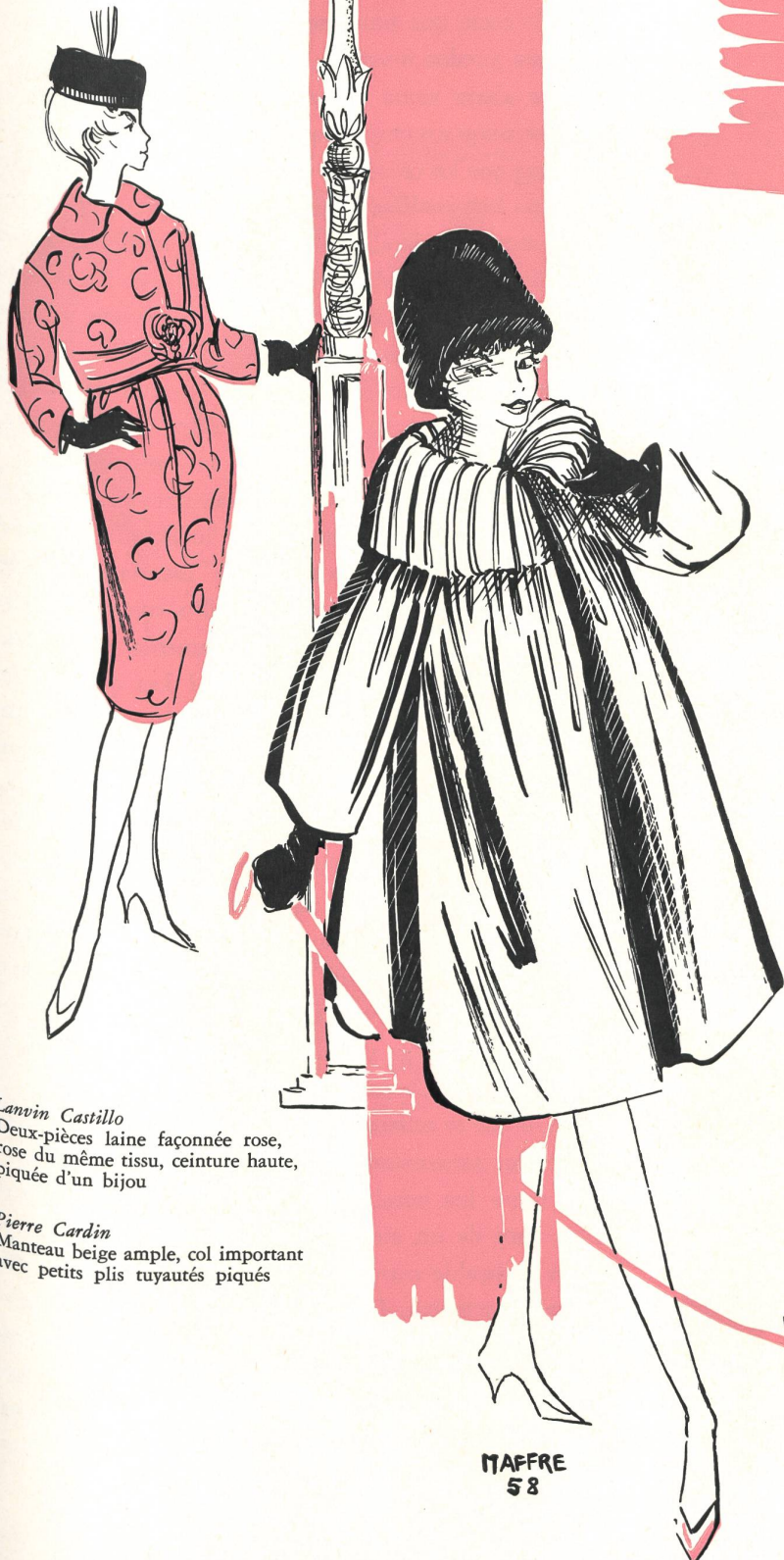
Lanvin Castillo Deux-pièces laine façonnée rose, rose du même tissu, ceinture haute, piquée d'un bijou