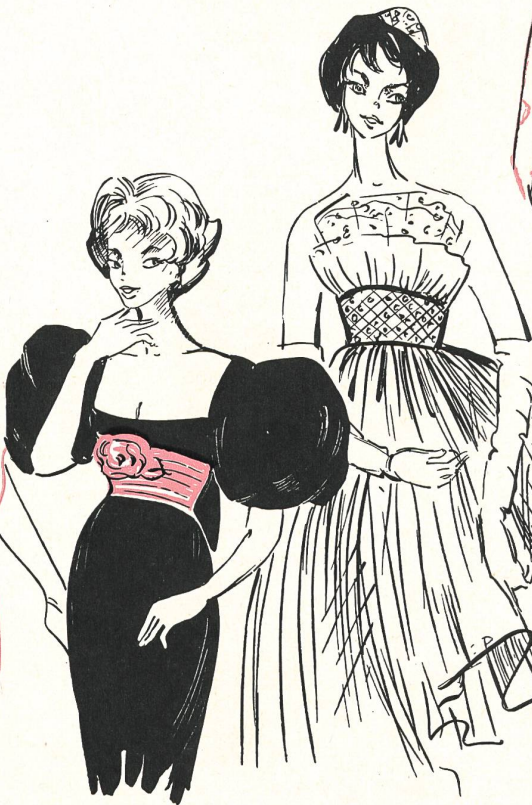
Pierre Balmain Ceinture de satin rose sur fourreau de velours noir