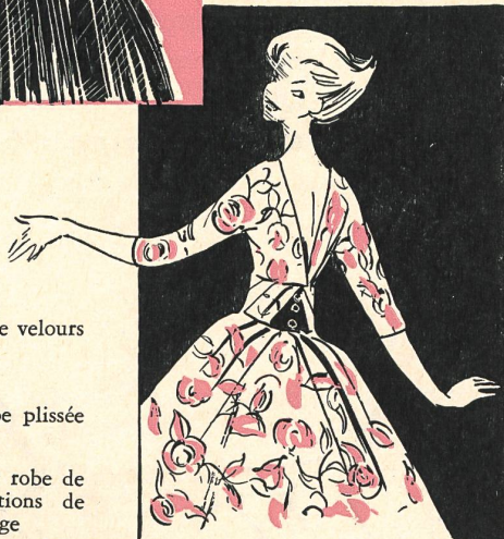
Pierre Cardin Taffetas bleu, taille haute