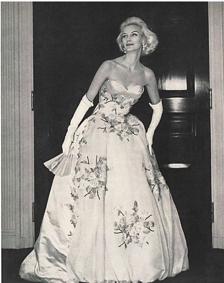
FOSTER WILLI & CO., SAINT-GALL

El que los tejidos finos de algodón, los bordados, las novedades de lana, los tejidos de mezcla, las mallas importadas de Suiza hayan adquirido una fama tan merecida en la confección americana, se lo deben en gran parte a los progresos incesantes de los procedimientos de acabado y de teñido. Wash-and-Wear, Drip-and-Dry, No-iron son las características muy modernas de los artículos suizos e inclusive de los delicados bordados y de los tejidos de