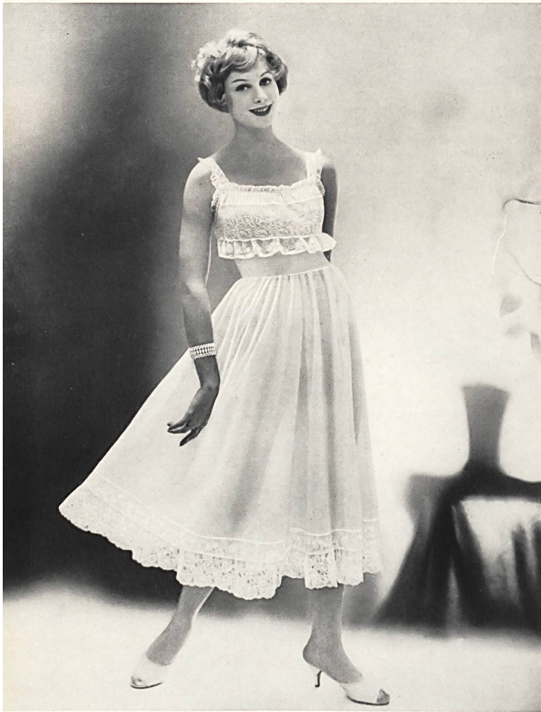
BISCHOFF TEXTILES LTD., SAINT GALL

Embroideries on nylon. Broderies sur nylon. Model by Kickernick, Inc., Minneapolis.