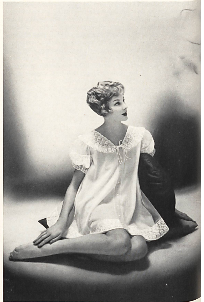
BISCHOFF TEXTILES LTD., SAINT-GALL

Embroideries on nylon. Broderies sur nylon. Model by Kickernick, Inc., Minneapolis.