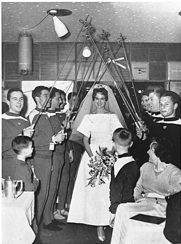
MISS AMERICA 1960: LINDA LEE MEAD

Respecto a Miss América, hemos de decir que el título que ostenta no corresponde al de una « reina » de belleza. Elegida anualmente entre las representantes de todos los estados de la Unión, incarna el tipo ideal de la juventud universitaria estadounidense. El haber sido elegida le impone el tener que participar a un número increíble de ceremonias, de banquetes, entrevistas, emisiones de radio y de televisión, así como la obligación de emprender un viaje de más de 200.000 kilómetros, lo cual no parece ser una sinicura. Después de un año de representaciones, Miss América recibirá una beca que la permitirá proseguir sus estudios universitarios durante cuatro años más.