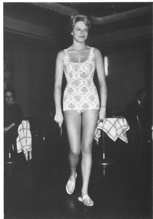
Bañador hecho de tela de „Helanca” estampada (Plus Wieler fils, Kreuzlingen).