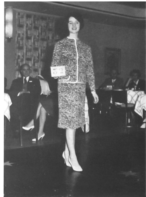
Dos piezas de malla jersey „Helanca” estampada (Duo, Aspor S. A., Porrentruy).

tan sólo al filamento, está siendo actualmente extendida. Así, por ejemplo, en Suiza, el derecho de utilizar la marca „Helanca” para los tejidos elásticos destinados a los pantalones para esquiar está ligada a la observación de determinados criterios de calidad; la fabricación de medias y de calcetines será también dentro de poco sujeta a condiciones semejantes y esta vigilancia será extendida poco a poco a todos los países. Únicamente de este modo podrá el propietario de la patente asegurar el mantenimiento de la calidad e impedir el envilecimiento de su marca, marca que, más que una simple designación específica, es un criterio de calidad. Tan sólo así estarán justificados los caudales invertidos en la propaganda. Pues lo cierto es que la empresa Heberlein, interesada en la expansión mundial de su invento, edita o hace editar por sus compañías „Helanca” en los distintos países un abundante material de propaganda y de información e inclusive unas bellísimas revistas de prestigio, tales como „France Helanca Information”, etc.