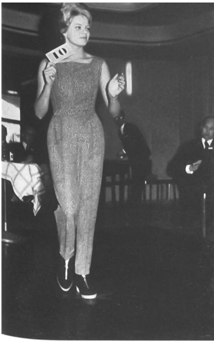
Traje de „Helanca” y lana, para después de la nieve (Respolco S. A., Zurich).