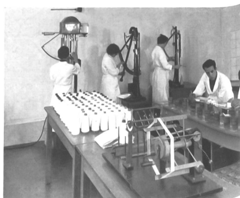
Verificación de la calidad de los hilados „Helanca“.

En el ramo de los calcetines para hombre, la introducción del „Helanca“ ha suprimido prácticamente la labor de zurcir. A este éxito se le debe el que esta nueva fibra se haya implantado e impuesto ya en tantos mercados, hasta el punto de que se tiende a utilizar el nombre de esta marca para designar comúnmente un producto, mientras que, en realidad, no todo lo que es fibra sintética frisada es verdaderamente „Helanca“. Con el fin de salvaguardar la reputación de su marca, la empresa Heberlein se ha visto obligada a adoptar medidas de comprobación para la calidad, y no sólo en lo que se refiere al producto semiterminado, es decir, al filamento, sino también a los artículos manufacturados. Ya hace tiempo que la casa Heberlein ha instituido un servicio técnico especial que le permite hacer visitar a cada uno de los poseedores de licencias de fabricación por un técnico y por lo menos una vez por trimestre. Este servicio ha sido luego ampliado de modo que, ahora, el propietario de la patente está en condiciones, no sólo de aconsejar a sus licenciados respecto a la fabricación de los hilados, sino también de poner especialistas a la disposición de los utilizadores del „Helanca“, o sea, de los tejedores y de los fabricantes de géneros de punto, para que aprendan a utilizar más acertadamente el filamento. La vigilancia en sí misma que se aplicaba primitivamente