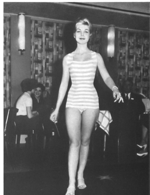
Bañador hecho de tela de malla „Helanca” (Lahco S. A., Baden).