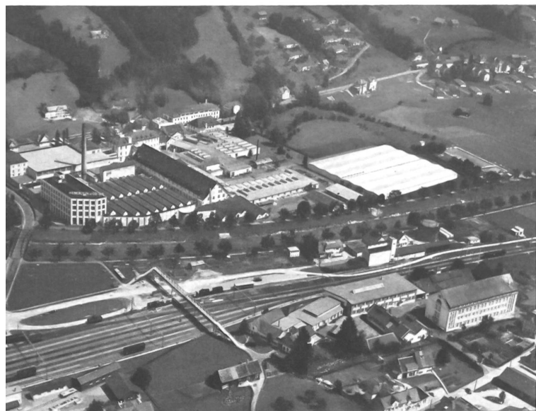
Vista general de los establecimientos Heberlein & Co., S.A., de Wattwil. A la derecha del centro se ve las nuevas naves de fabricación del „Helanca“.

Ya antes de la guerra, la empresa Heberlein & Cía. S.A., de Wattwil, empezó a buscar el procedimiento conveniente para rizar los filamentos de rayón con objeto de poder fabricar con este material hilados extensibles. El hilo así obtenido y al que se le dio el nombre de „Helanca“ obtuvo cierto éxito durante la guerra para reemplazar la lana que, por entonces escaseaba, en la confección de canastillas y de vestidos para niños. Una vez terminada la guerra, la lana volvió a aparecer en el mercado y puso así término a la carrera del primer tipo de „Helanca“. Pero las fibras sintéticas hicieron su aparición y la casa Heberlein emprendió sin desmayo nuevas investigaciones para llegar a aplicar su invento a los filamentos continuos de nilón. Así es cómo llegó a ser creada la fibra que ha llegado a ser conocida ahora bajo el nombre de „Helanca“ y que, frente al tipo precedente, posee unas cualidades muy superiores debido a la mayor estabilidad de los filamentos de nilón respecto a los de viscosa. El primer ramo que supo aprovechar las características extraordinarias de este nuevo filamento fue la calcetería, principalmente para los calcetines y las medias. En esta esfera, se puede hablar por cierto de una verdadera revolución.