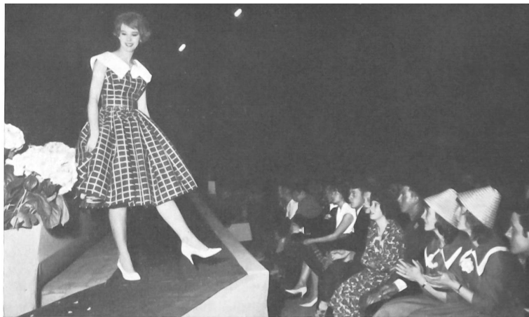
Vista tomada durante el desfile de moda.

de la alta costura y de la confección suizas, todos ellos ejecutados con tejidos Stoffel.