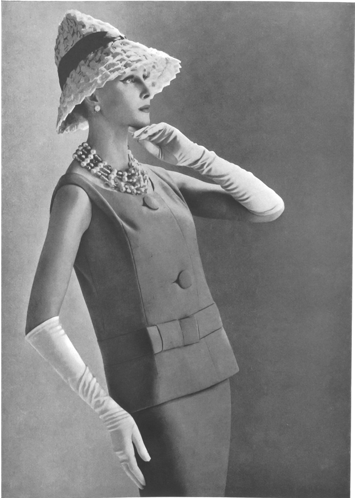
PIERRE CARDIN Tissu « Lascara » de Weisbrod-Zurrer Fils, Hausen s. A.

Pour certains de nos lecteurs, nous reproduisons sur ces pages encore quelques modèles des collections d'été 1960