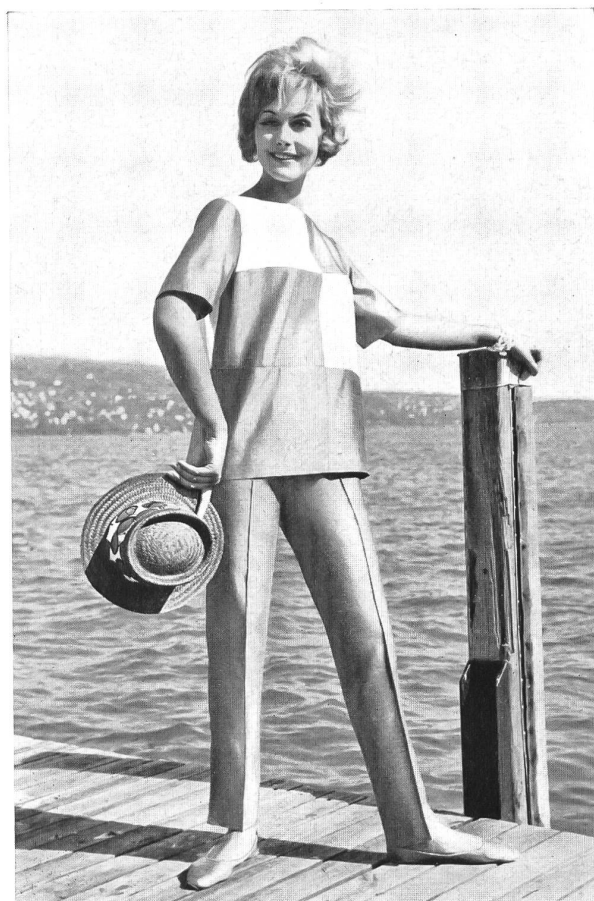
Satin douppion, pure soie.