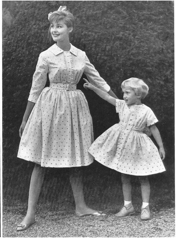
SETARTI S. A., ZURICH

Batiste Minicare brodée en noir. — Black embroidery on Minicare batiste. — Batista Minicare bordado en negro. — Minicare Batist mit schwarzer Stickerei Modèle E. & R. Braunschweig, Zurich