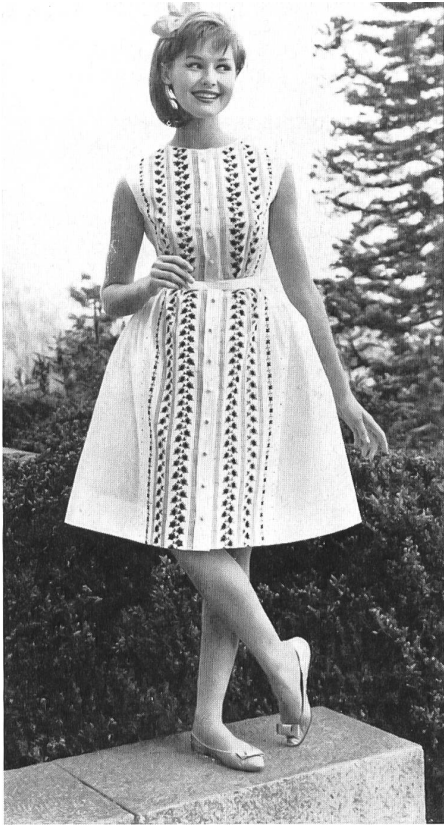
JACOB ROHNER S. A., REBSTEIN

Tissu Minicare brodé. — Embroidered Minicare fabric. — Tejido bordado Minicare. — Minicare Stickerei Modèle R. Cafader & Co., Zurich