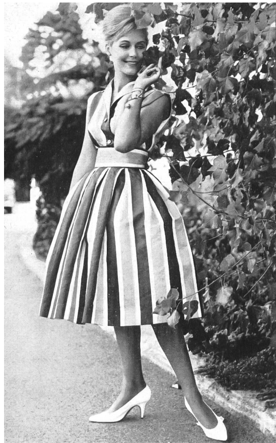
Satin douppion, pure soie.