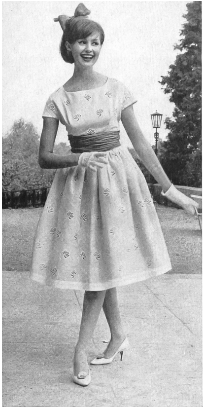
« FISBA », CHRISTIAN FISCHBACHER CO., SAINT-GALL

Tissu Minicare brodé. — Embroidered Minicare fabric. — Tejido bordado Minicare. — Minicare Stickerei Modèle R. Cafader & Co., Zurich