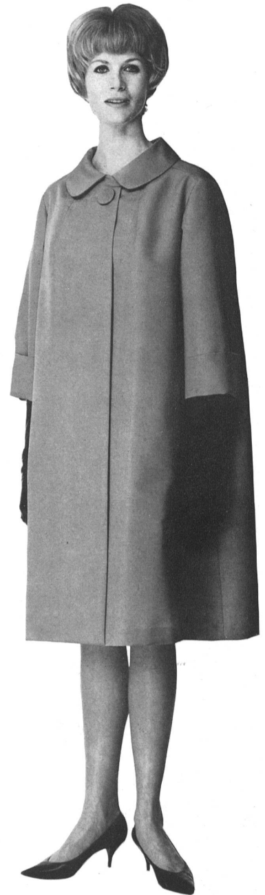
ROBT. SCHWARZENBACH & CO., THALWIL

Batiste Minicare brodée Modèle Manuela, Nice Distribué par Montex, Paris