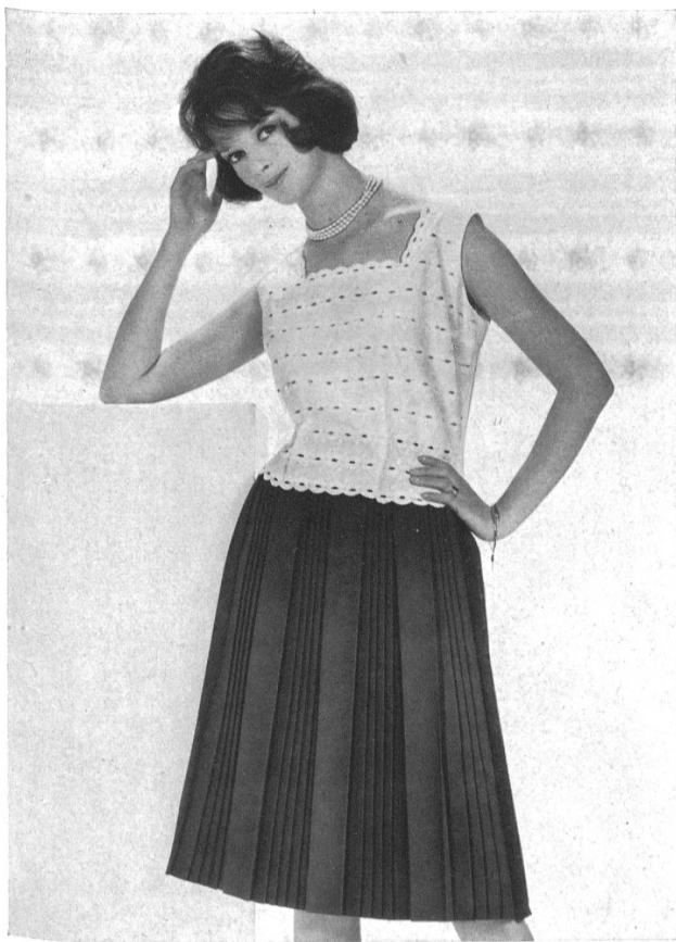
NEUBURGER & CO. A.G., SAINT-GALL

Guipure Modèle Wollenschläger & Co. G.m.b.H., Baden-Baden (Allemagne)