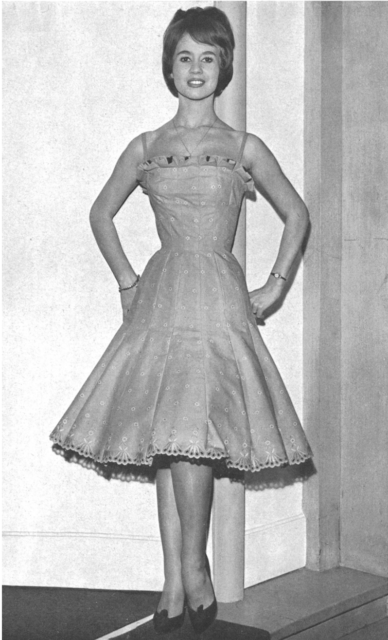
« RECO », REICHENBACH & CO., SAINT-GALL

Batiste Minicare brodée Modèle Manuela, Nice Distribué par Montex, Paris