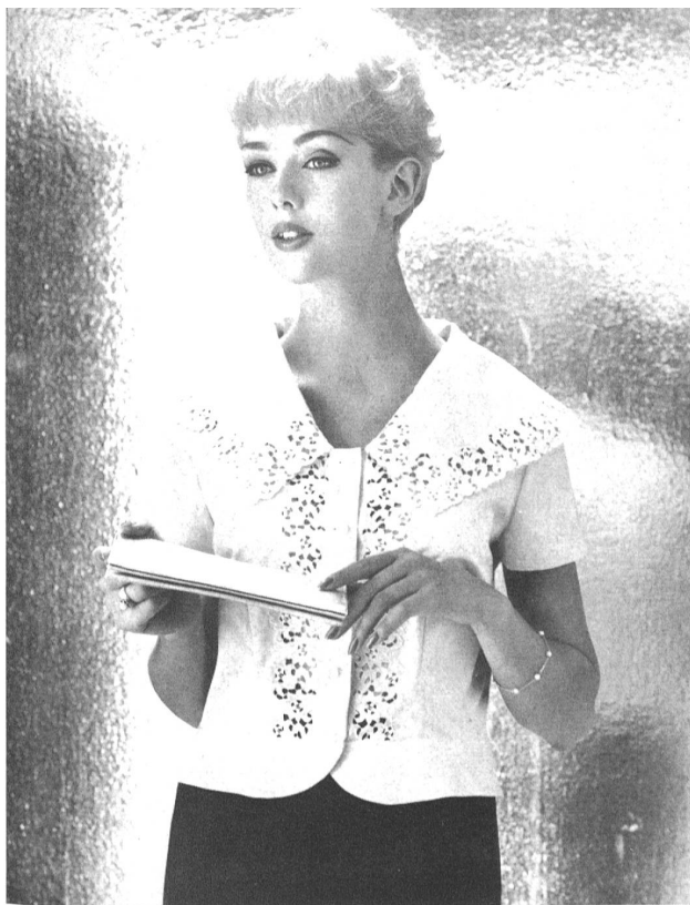
FORSTER WILLI & CO., SAINT-GALL

Guipure Modèle Wollenschläger & Co. G.m.b.H., Baden-Baden (Allemagne)