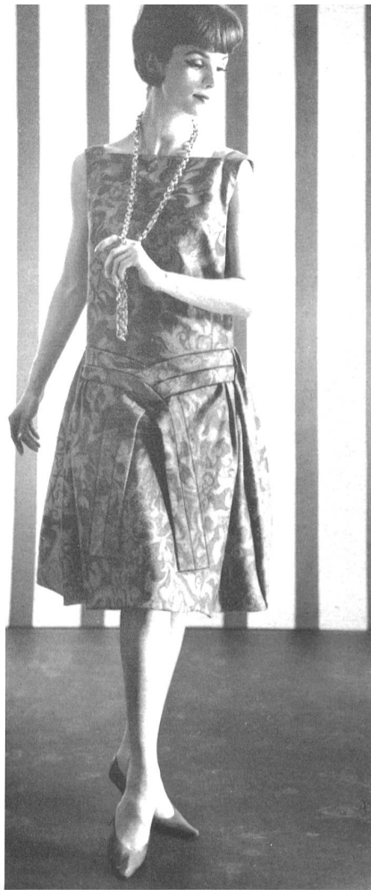
CHRISTIAN FISCHBACHER CO., ▲ SAINT-GALL Tejido de algodón estructurado y estampado Modèle Couture Marianne, Saint-Gall