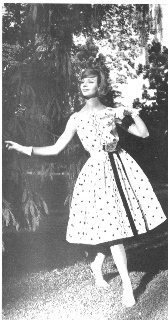
UNION S. A., SAINT-GALL Broderie - Embroidery - Bordado - Stickerei Modèle Macola AG., Zurich