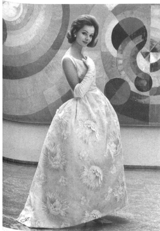
A. NAEF & CIE, FLAWIL Broderie - Embroidery - Bordado - Stickerei Modèle Mira, H. Grossenbacher AG., Zurich