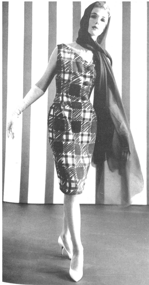
CHRISTIAN FISCHBACHER CO., ▲ SAINT-GALL Tejido de algodón estructurado y estampado Modèle Jeanpalmério, Zurich