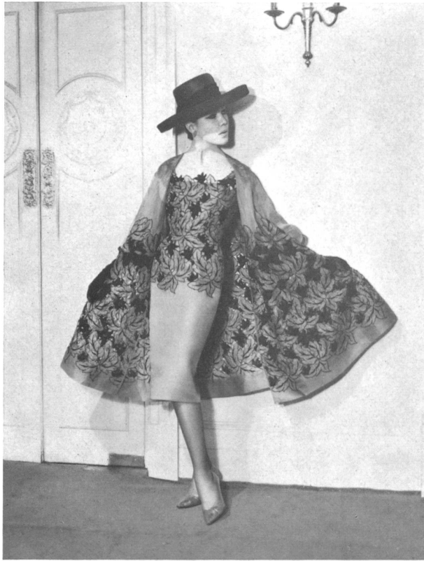
Organdi de soie café avec broderie de soie noire à jour Coffee silk organdie with openwork black silk embroidery Modèle Lachasse, Londres