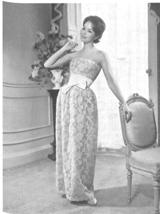
Broderie lin sur tulle Linen embroidered tulle Modèle Ronald Paterson, Londres