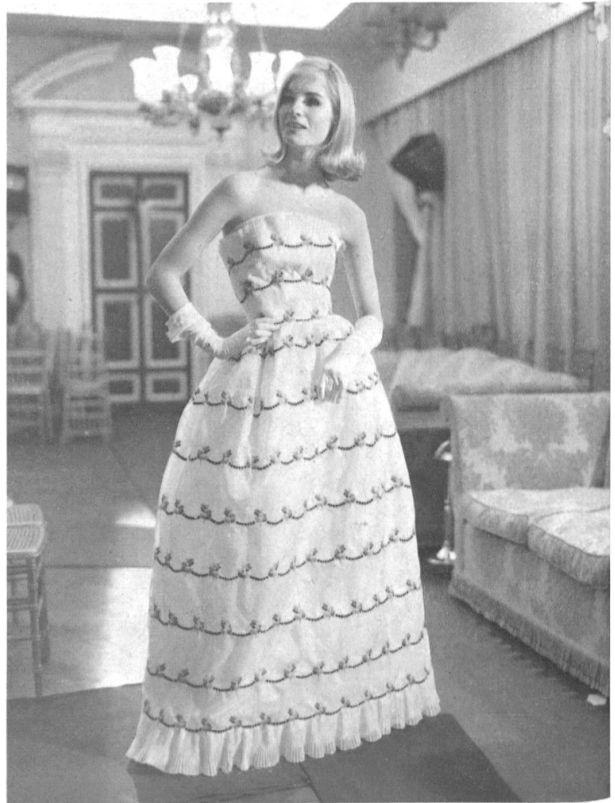
Organdi de soie blanc avec broderie multicolore Multicolor embroidered white silk organdie Modèle Belinda Belville, Londres