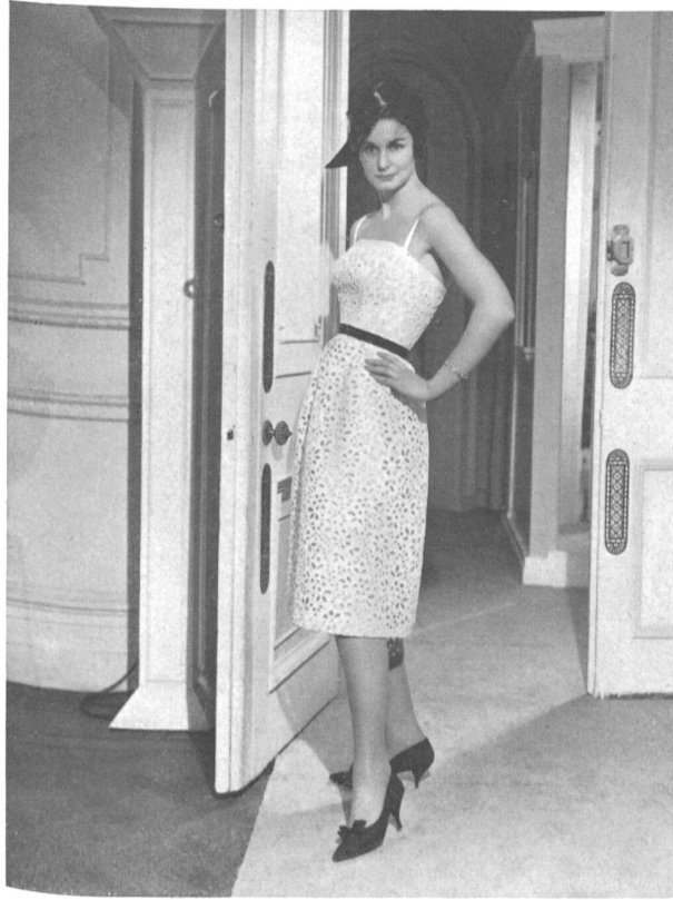
Coton brodé crème Cream embroidered cotton Modèle John Cavanagh, Londres