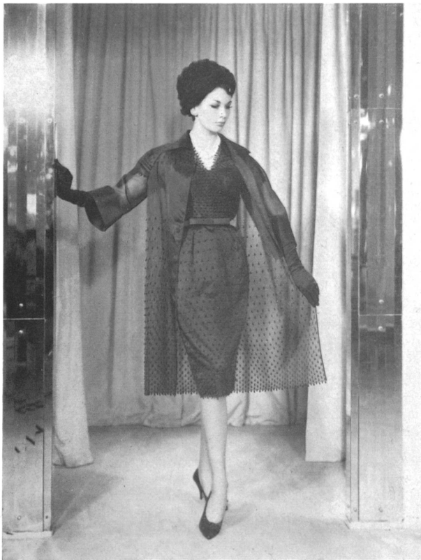
Organdi de soie bleu marine brodé de pois en relief Navy blue silk organdie with embroidered raised spots Modèle Norman Hartnell, Londres