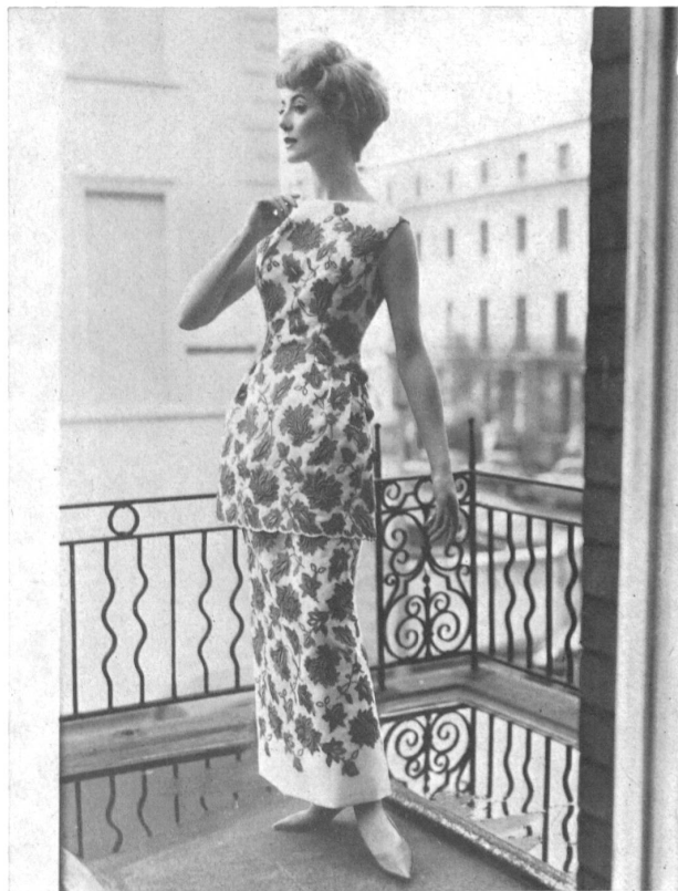
Organdi de soie brodé en blanc et rouge White and red embroidered silk organdie Modèle Mattli, Londres