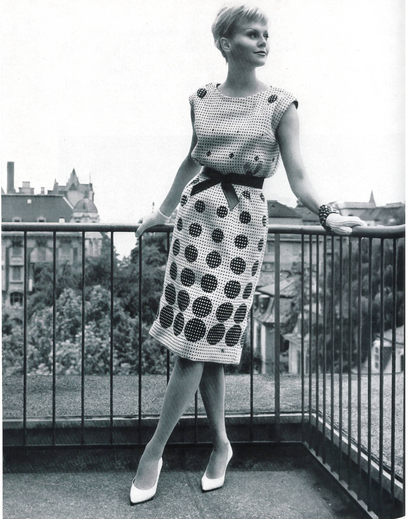
MAX KIRCHHEIMER FILS & CIE, ZURICH Tissu — fabric — tejido — Gewebe Modèle Cortesca A.-G., Zurich