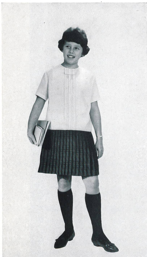
HEER & CIE S. A., THALWIL Térylène/laine (blouse et jupe) Modèle Leumann, Boesch & Cie S. A., Kronbühl