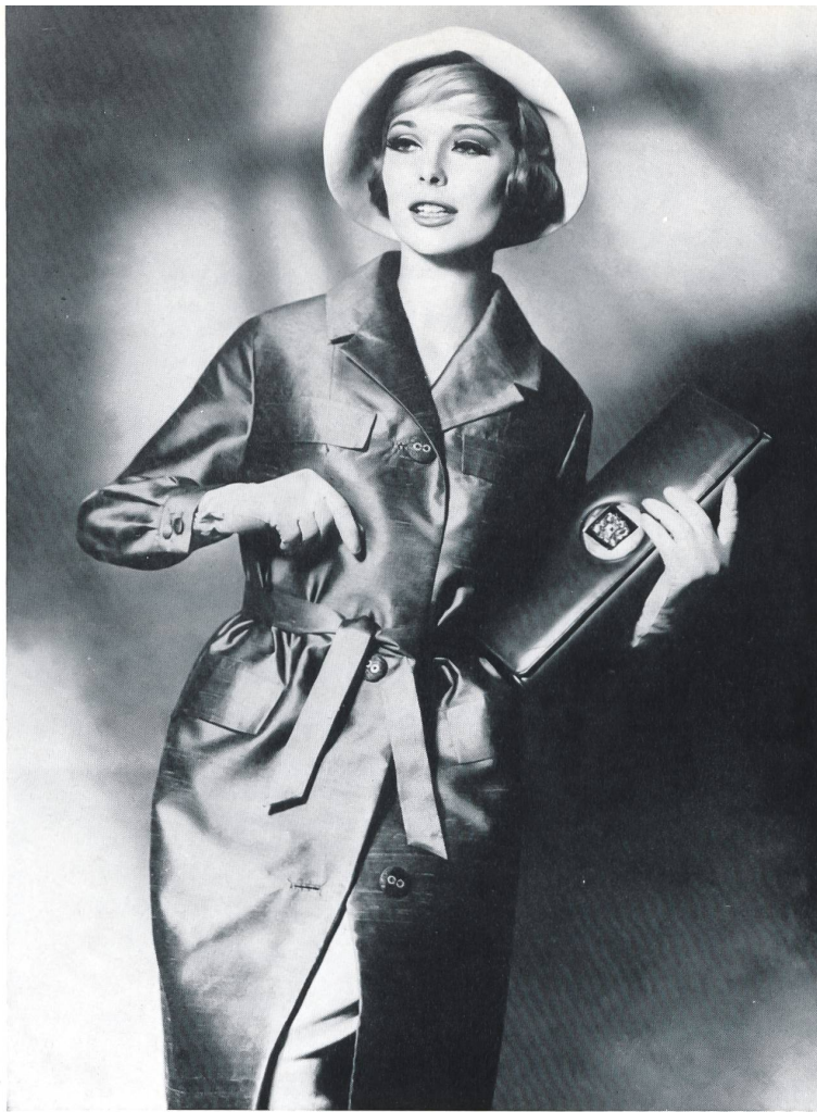
HEER & CIE S. A., THALWIL Shantung pure soie Imperméable de Dumas, Egloff S. A., Châtel-Saint-Denis