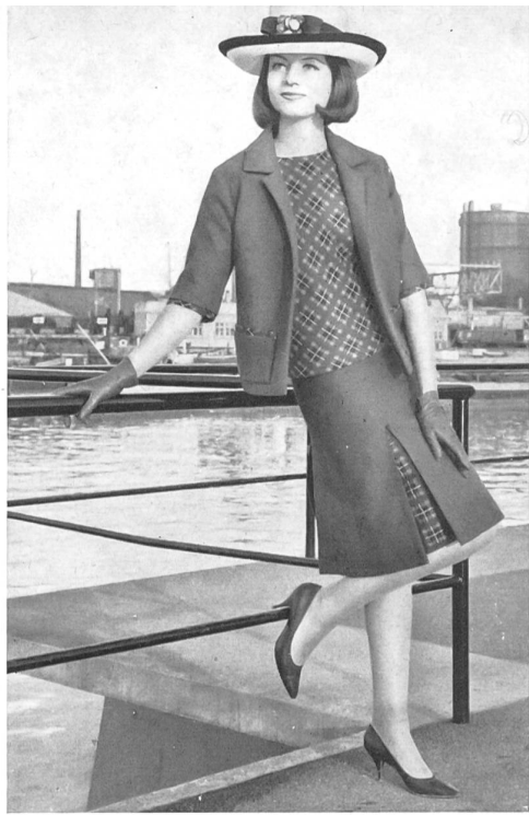
Coton tissé en couleurs et uni. Colour-woven and plain cotton fabric. Algodón tejido en colores y liso. Buntgewebte und uni Baumwolle. Modèle Hugo Brandeis A.-G., Zurich.