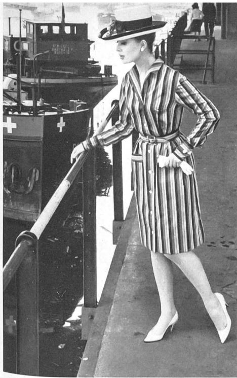
Coton tissé en couleurs. Colour-woven cotton fabric. Algodón tejido en colores. Buntgewebte Baumwolle. Modèle Kurt A.-G., Lucerne.