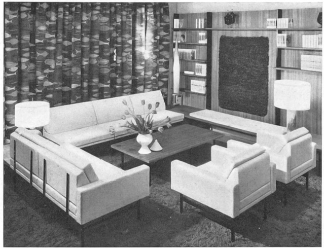
Un beau rideau en tissu de coton imprimé suisse, exposé chez Idealheim S. A., Bâle. An attractive curtain in a Swiss cotton print, on display at Idealheim Ltd., Basle. Una hermosa cortina suiza de género de algodón estampado expuesta en la tienda de Idealheim S. A., Basilea. Ein schöner Vorhang aus bedruckter Baumwolle ausgestellt in der Idealheim A.-G., Basel.

Ya es sabido que, independientemente de la boga siempre renovada del bordado suizo, los continuos esfuerzos de los productores para hacer del algodón un tejido noble, tan agradable de usar como elegante, han desarrollado considerablemente la importancia económica de este ramo. En 1961, la exportación suiza de productos de algodón llegó a los 379 millones de francos suizos ($ USA = 88,6 millones) de los cuales un poco más de la tercera parte consistía en bordados. Durante el mismo año, Suiza ha exportado más de 4800 toneladas de hilos y torzales de algodón, mitad y mitad de cada clase, y 7474 toneladas de bordados y de tejidos de algodón. La hilatura de algodón ocupa en Suiza 1,3 millones de husos y la torceduría ot ros 350.000, mientras que funcionan