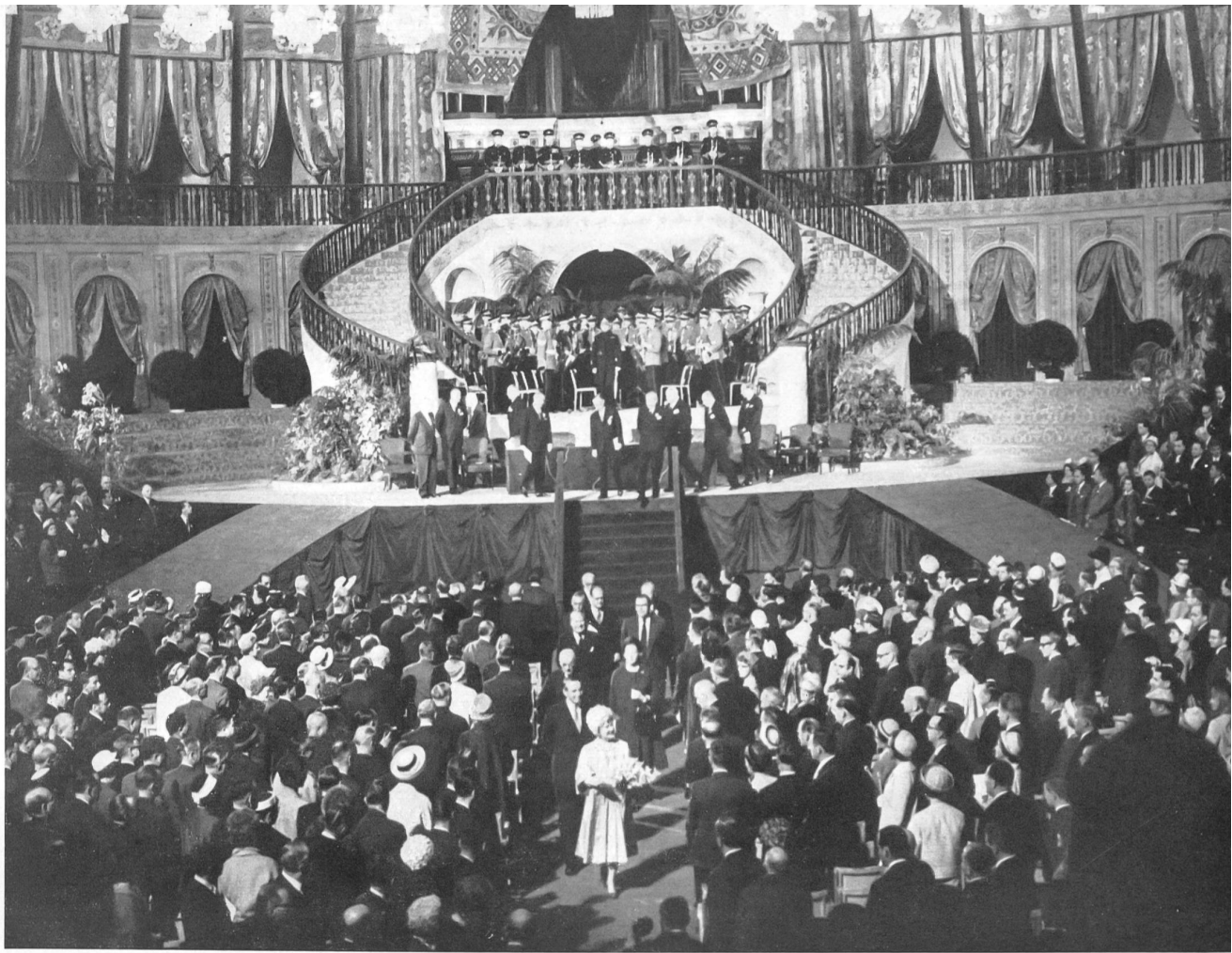
Después de pronunciar el discurso inaugural, la Reina-Madre Isabel abandona la sala del Congreso.

cantes y confeccionadores. Debe ser concedida especial atención a la calidad y al uso, con el fin de poder satisfacer las exigencias cada vez más precisas de los consumidores...» (Resolución 3). «Las conferencias técnicas... han llamado la atención sobre los progresos enormes realizados recientemente por todos los sectores de la industria textil. Ejemplos que cubren una gama muy amplia de utilidades textiles han demostrado lo que podía esperarse de las investigaciones y aplicaciones realizadas mancomunadamente por los productores de fibras químicas y por sus