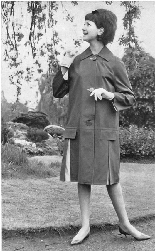
STOFFEL S.A., SAINT-GALL Tissu hydrofuge « Aquaperl » sur mousse de plastique Water repellent foamback « Aquaperl » fabric Modèle Heptex