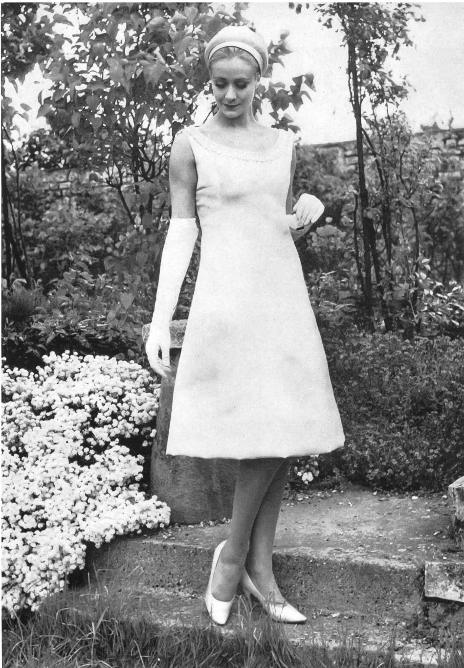
L. ABRAHAM & CIE, SOIERIES S.A., ZURICH Satin double-face Modèle Christian Dior Ltd., Londres

un gorro alto de leopardo con una confortable corbata alta así como un accesorio de peletería poco común, pero útil, un tapabocas de « renard » gris pálido. Los vestidos de seda eran más bonitos que nunca e ilustraban muy bien la comprensión de Paterson frente a las exigencias de la vida actual. Sus vestidos hacen soñar despierta y le gustaría a una llevarlos puestos, y cuando dice: « Yo creo para las circunstancias y las exigencias de la vida contemporánea y para esta era del twist », se conoce que sabe lo que se hace. Su mujer, rubia y alegre, está asociada a su negocio de Albermarle Street; forman así un equipo de « rompe y rasga » en el mundo de la moda.