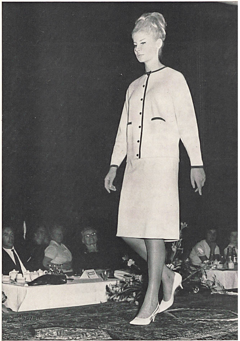
Deux-pièces en jersey laine blanc bordé de galons rouge et marine (Modèle TANNER) Two-piece outfit in white woollen jersey edged with red and navy-blue braid (a TANNER model) Dos piezas, de malla jersey blanca de lana rebordeada con galones rojos y azul marino (Modelo TANNER) Deux-Pièces aus weissem Woll-Jersey, mit roten und dunkelblauen Tressen eingefasst (Modell TANNER)