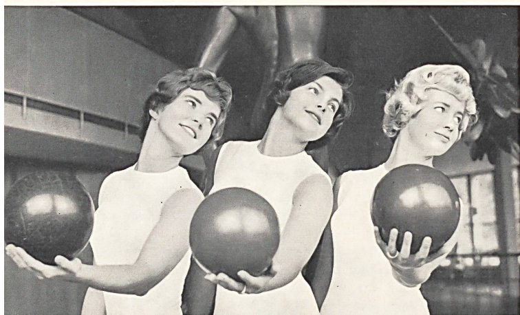
Trois jeunes filles du groupe « Malmöflickorna » Three girls of the « Malmöflickorna » group Tres muchachas jóvenes del grupo « Malmöflickorna » Drei junge Mädchen aus der Truppe der « Malmöflickorna »

Si hablamos de belleza, no sólo es porque los modelos presentados se lo merecían, sino también por el modo de presentarlos y por la calidad de las señoritas que servían de maniqués, elementos que contribuyeron en gran parte al éxito de este acontecimiento organizado por la Asociación Suiza de los Fabricantes de Calcetería en colaboración con la Société de la Viscose Suisse, de Emmenbrucke y de la casa Heberlein & Co., de Wattwil. En efecto, estuvieron encargadas de la presentación las alumnas de la escuela « Malmöflickorna » de Malmö (Suecia) donde aprenden