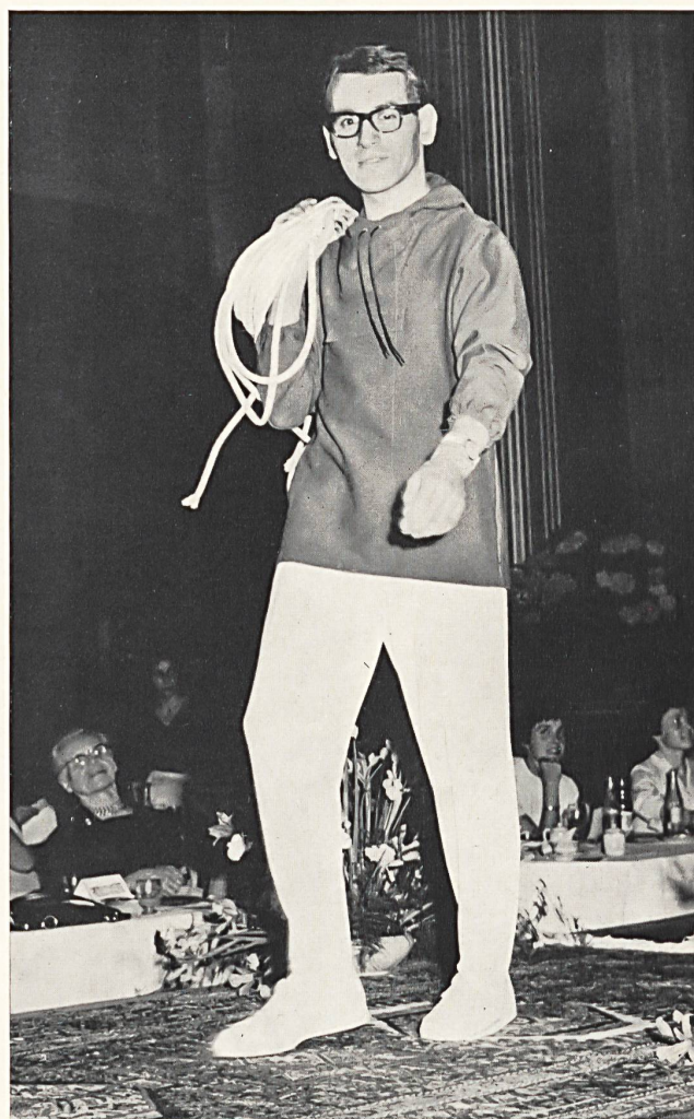
Tenue en « Hélanca »/« Nylsuisse » pour marins d'eau douce « Helanca »/« Nylsuisse » outfit for freshwater mariners Vestido de « Helanca »/« Nylsuisse » para marineras de agua dulce Ausrüstung aus « Helanca »/« Nylsuisse » für Süßwasser-Schiffer