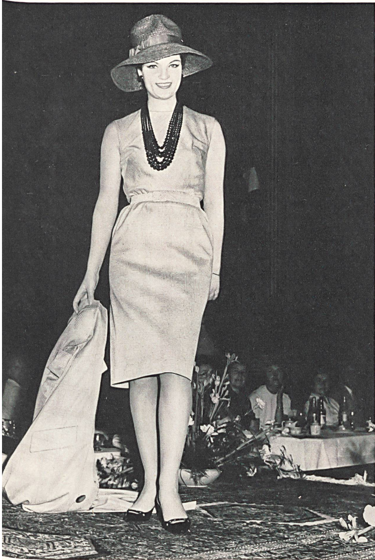
Robe et manteau en jersey Conit/coton (Modèle VOLLMOELLER) Dress and coat in Conit/cotton jersey (a VOLLMOELLER model) Vestido y abrigo de malla jersey Conit/algodón (Modelo VOLLMOELLER) Kleid und Mantel aus Conit-Baumwolljersey (Modell VOLLMOELLER)