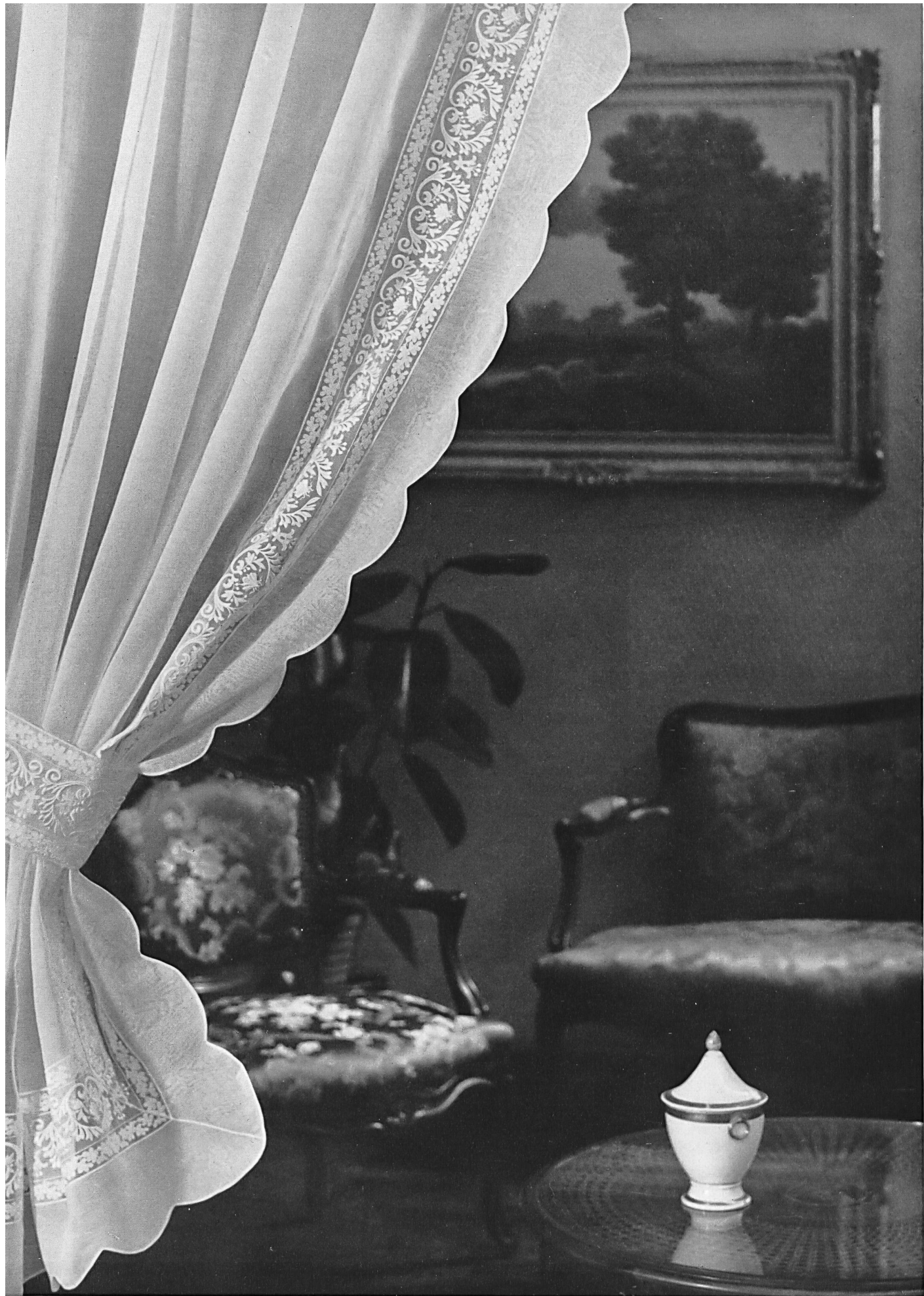
FORSTER WILLI & CO., SAINT-GALL Rideau d'organdi avec galon de broderie incrusté Organdie curtain with embroidered braid insertion Cortina de organdi con galón de bordado incrustado Organdivorhang mit eingesetztem Stickereigalon