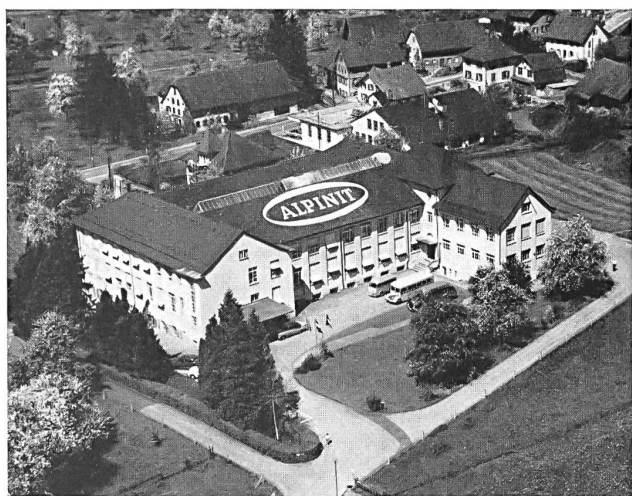
Vista aérea de la fábrica « Alpinit » en Sarmenstorf

El éxito, que ha hecho del nombre « Alpinit » una de las marcas representativas de la calidad suiza en el ramo de la calcetería — tanto en el país como en el extranjero — parece no tener historia, como el destino de los pueblos felices (según dice la sabiduría de las naciones). Esto no quiere decir empero que el éxito haya venido de por sí solo... También la coyuntura ha contribuido a ello, por cierto, pero el auge económico no podría haber surtido ningún efecto sin otros factores importantes, como la perseverancia, la clarividencia comercial, el estudio y conocimiento de los mercados, el buen gusto y, sobre todo, la fidelidad sin reserva al principio de la calidad.