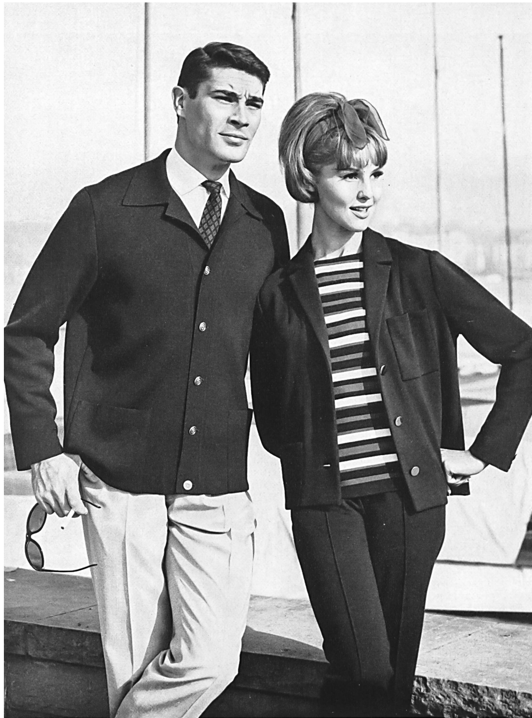
Elegante blazer para caballero, de malla pura lana. Apuesto conjunto de tricot pura lana, para señora: blazer, pulóver listado fantasía, pantalón

vuelven más suaves al tacto, pero lo principal es que se emplee los telares de punto más apropiados.