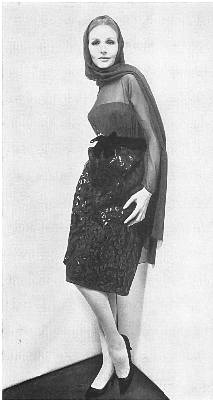
FORSTER WILLI & CO., SAINT-GALL

El traje negro sigue siendo chic, pero el color negro ha de poseer una nota particular para poder afirmarse en la lucha por la competencia con los colores de las flores. A los trajes negros se les da generalmente esa nota de