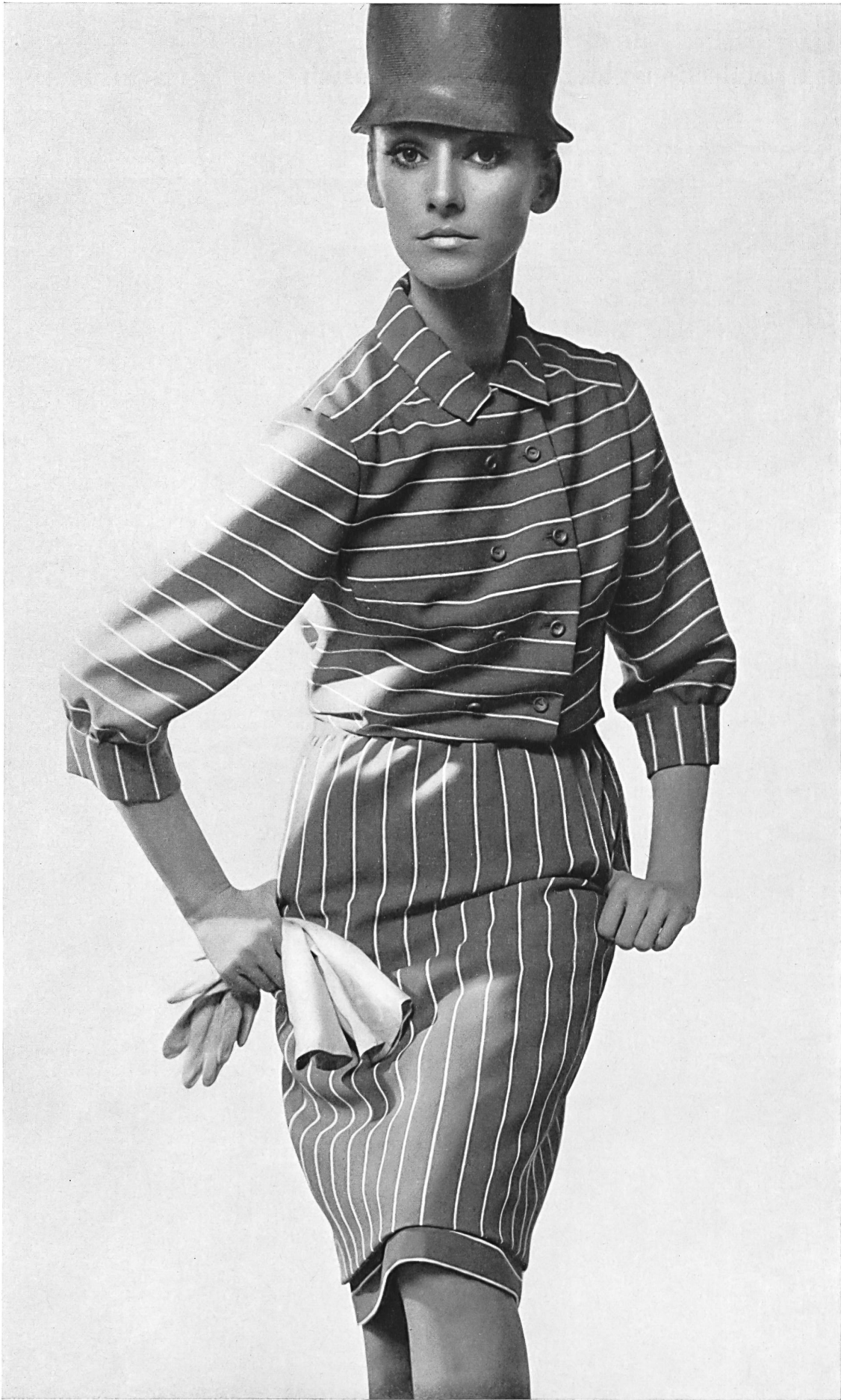
JACQUES HEIM Crêpe « Charleston » imprimé de L. Abraham & Cie, Soieries S. A., Zurich