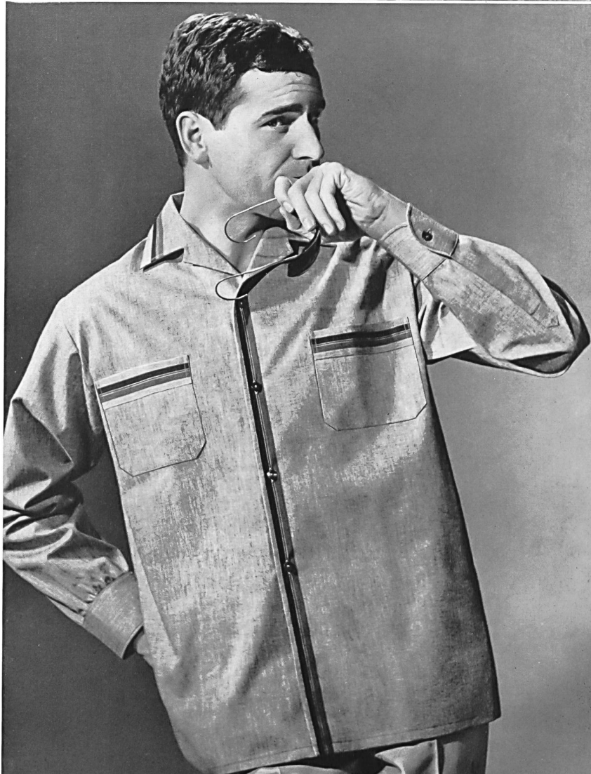
« LUTTEURS », LES FILS FEHLMANN S. A., SCHÖFTLAND Chemise-veste de coton pour les jours chauds, avec amusante garniture de couleur Loose cotton shirt for hot summer days with attractive edging Camisa chaqueta de algodón para los días calurosos, con divertido adorno en color Baumwollene Chemisette für heisse Tage mit amüsanten Bordüren-Garnitur