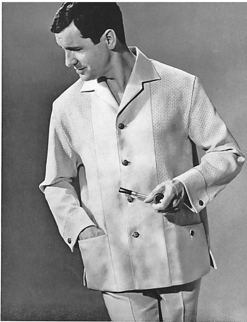
« LUTTEURS », LES FILS FEHLMANN S. A., SCHÖFTLAND Frais ensemble d'été en coton combiné avec tissu poreux Cool summer suit in cotton combined with porous fabric Conjunto fresco para verano, de algodón combinado con tejido poroso Kühles Baumwoll-Sommer-Ensemble mit porösem Gewebe