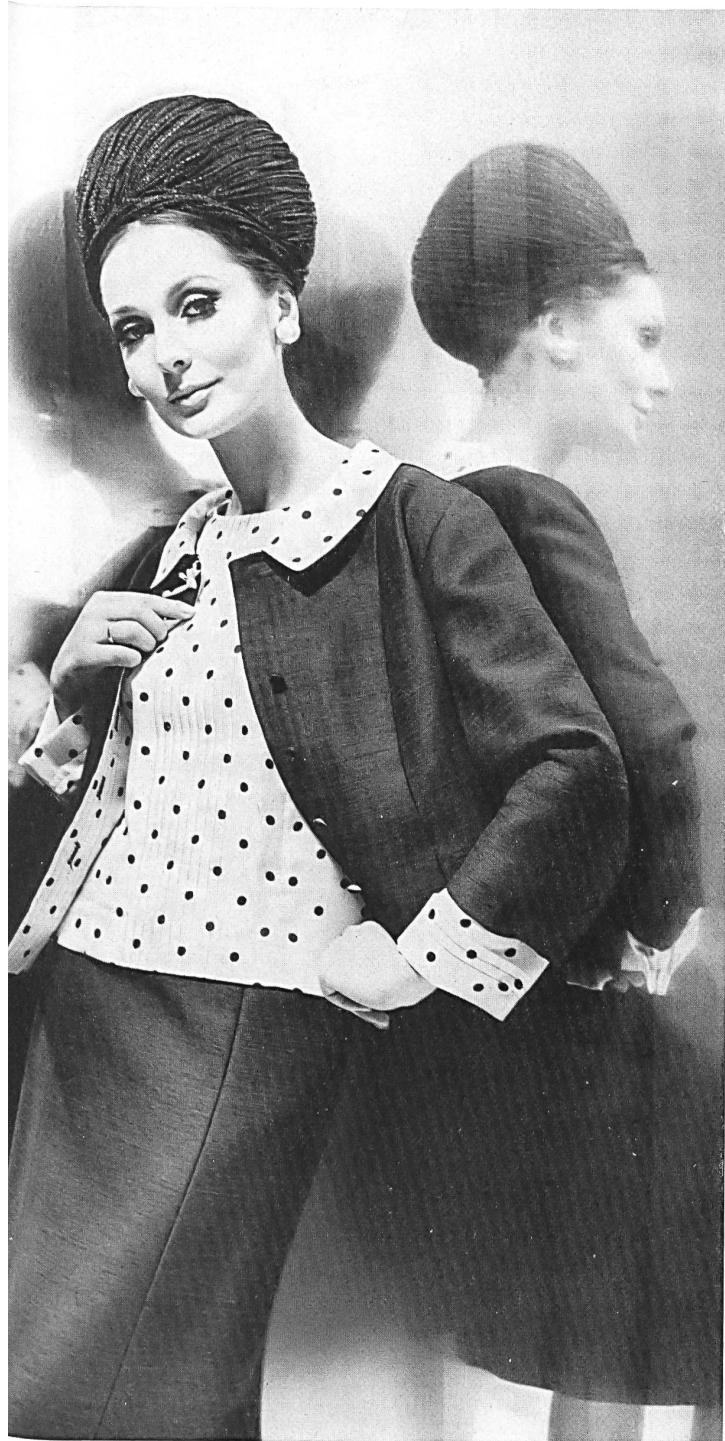
HEER & CIE S.A., THALWIL Shantung fibranne infoissable (crease resisting / inarrugable / knitterfrei) et twill imprimé (printed / estampado / bedruckt) Modèle Willy Meyer S.A., Zurich