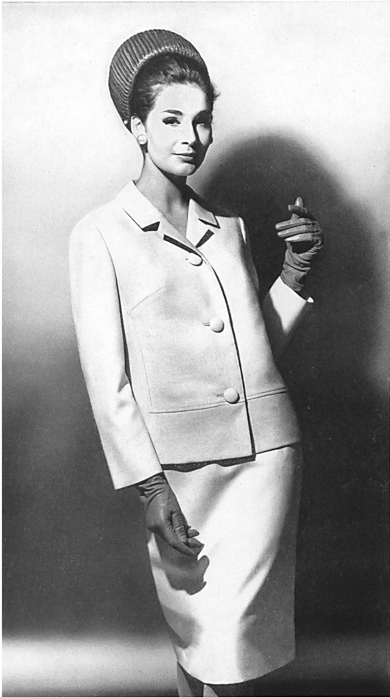
HEER & CIE S.A., THALWIL Fresco de « Terylène » et laine (« Téry- lène » and Wool / « Terileno » y lana / « Terylene » und Wolle) Modèle Paul Weibel A.G., Gossau