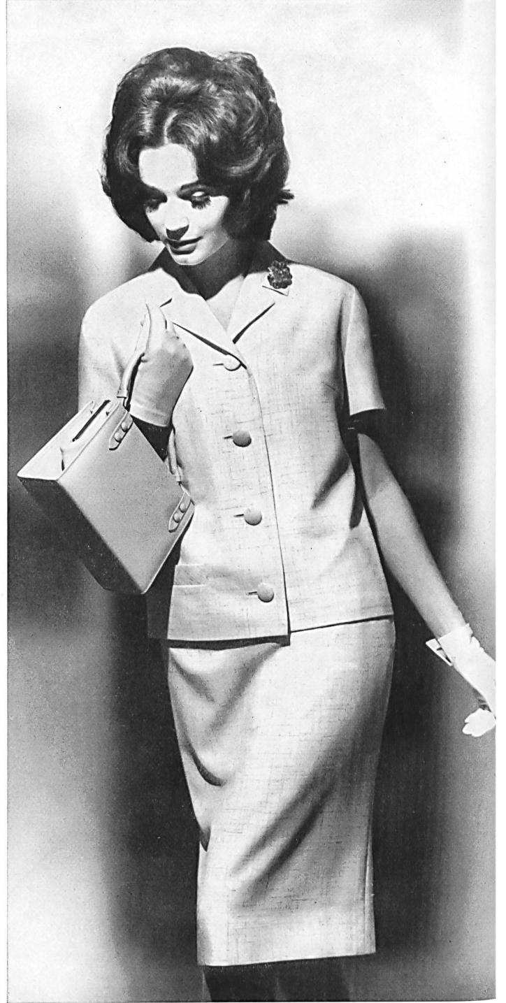
HEER & CIE S.A., THALWIL Shantung de « Terylène » et laine (« Tery- lene » and wool / « Terileno » y lana / « Terylene » und Wolle) Modèle Paul Weibel A.G., Gossau