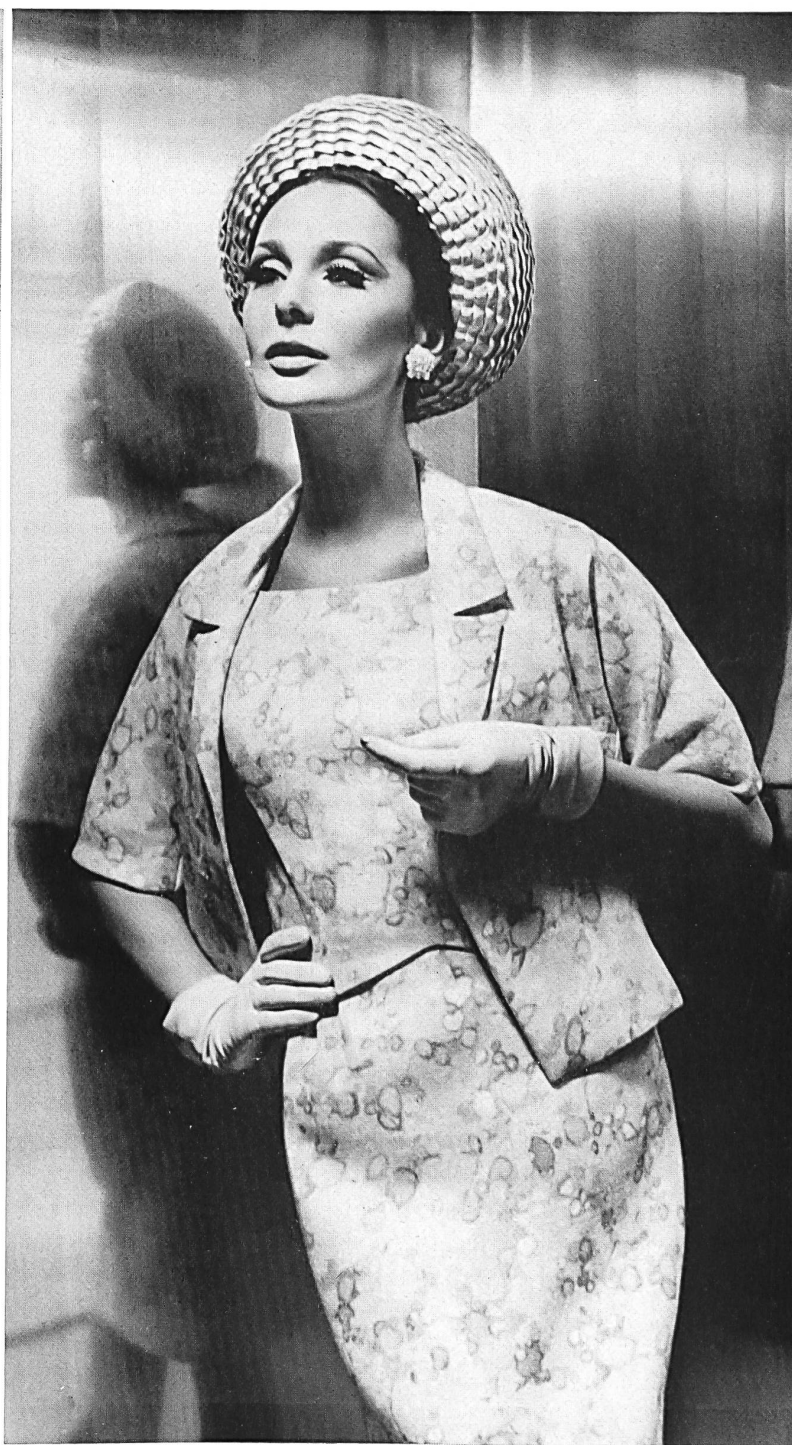
HEER & CIE S.A., THALWIL Fresco shantung imprimé (printed / estampado / bedruckt) Modèle Willy Meyer S.A., Zurich