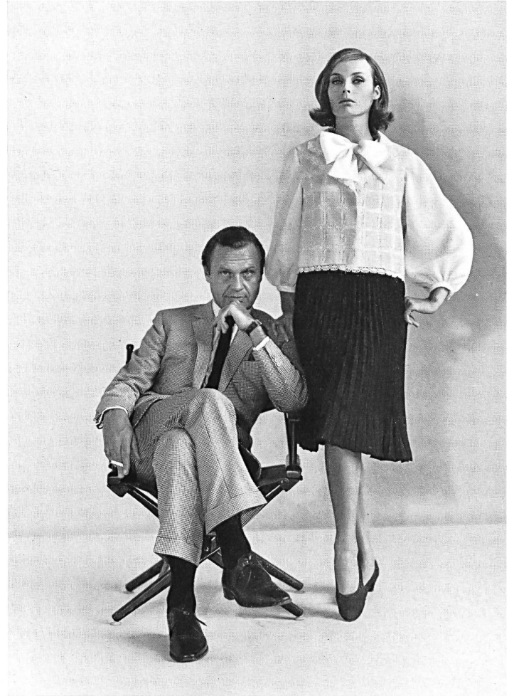
Swiss Fabric and Embroidery Center, New York

Bill Blass, of Maurice Rentner Ltd., the current return Coty Award winner, here shows one of his models, a three-piece suit featuring a pintucked sleeveless jacket frosted with Swiss guipure lace insets.