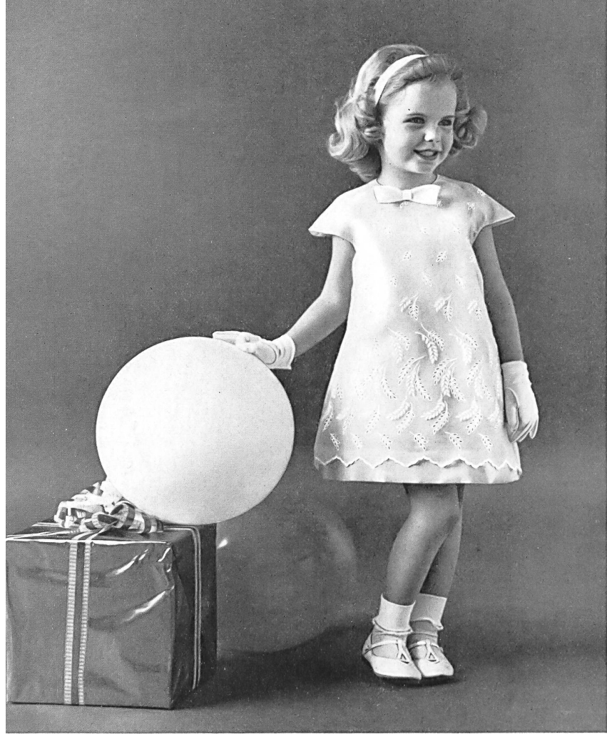
« NELO », J. G. NEF & CO. S.A., HÉRISAU Organdi blanc brodé White embroidered organdie Modèle de Youngland