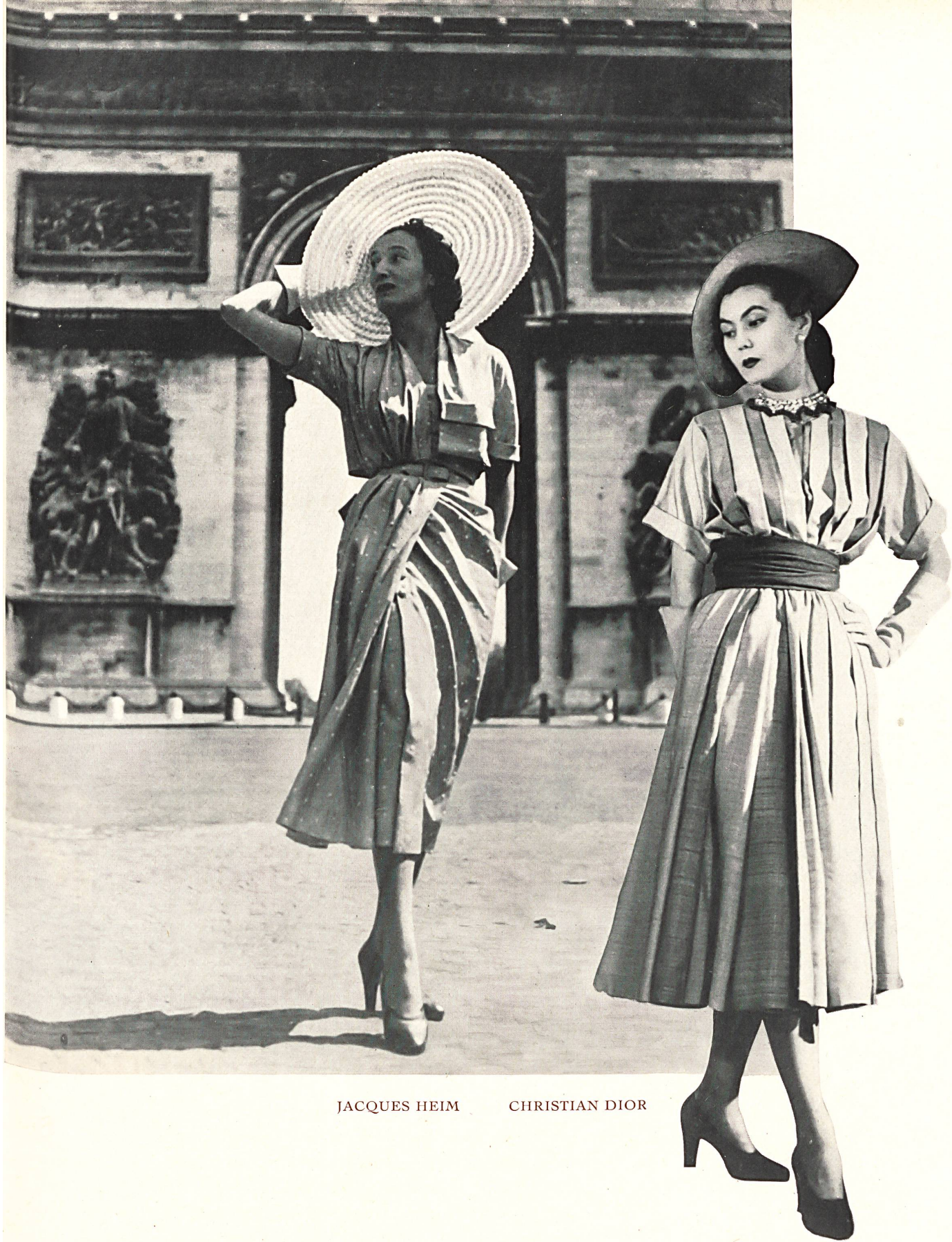
JACQUES HEIM CHRISTIAN DIOR