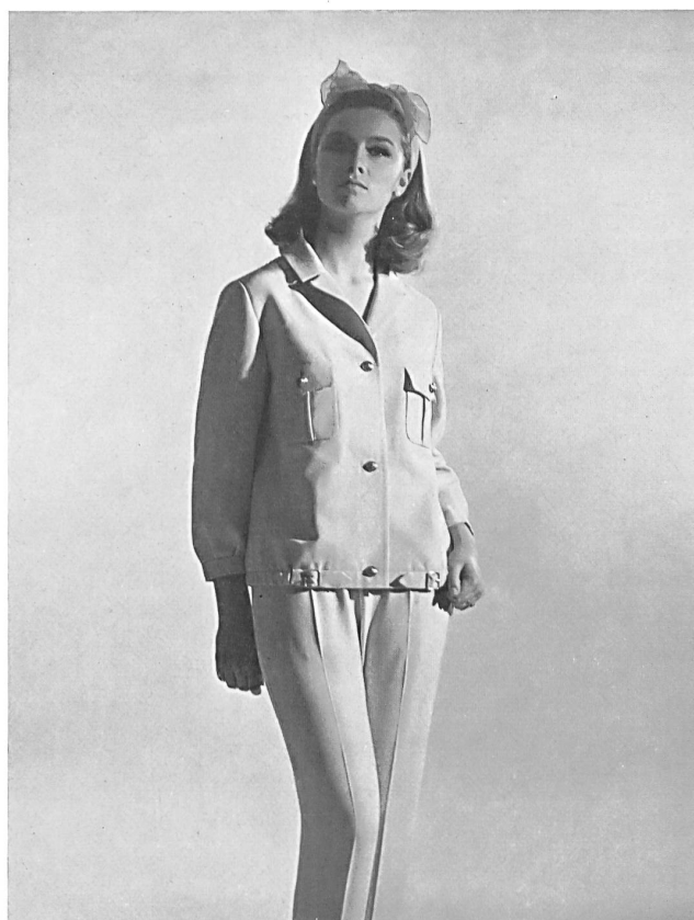
Deux-pièces de sport en «Hélanca», 100 % «Térylène» Modèle: Jacob Weil & Co., Zurich

Recientemente tuvo lugar en Zurich la exposición de tejidos a base de «Terylene» producidos en todos los países de la AELC, a la que participaron, entre otros, 40 fabricantes suizos. Llamaron la atención principalmente los productos de «Sedusa», un tejido fino estilo batista de puro «Terylene» con el que se puede producir bordados fáciles de cuidar. También de puro «Terylene», mencionaremos los tejidos elásticos y los artículos de malla hechos con el nuevo hilo texturizado, llamado «Crimplene». Entre los tejidos mezclados mencionaremos dos que, gracias a un nuevo procedimiento de acabado, son suaves y lanosos al tacto, los numerosos dibujos de mezclas con lana, y los tejidos para vestidos impermeables de mezclas con lana, algodón o rayón, impregnados y a menudo también contrapegados con espuma de plástico, así como un nuevo satén «Terylene»-algodón.