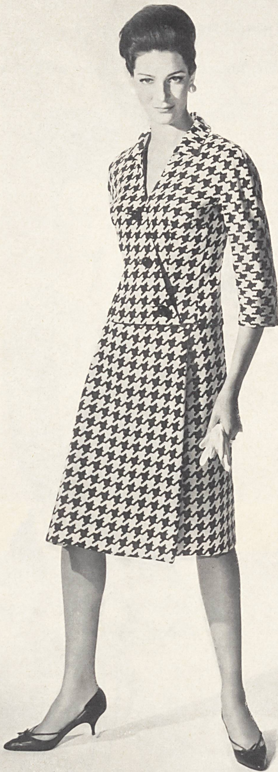
METTLER & CIE S.A., SAINT-GALL Tissu fibranne imitation lin imprimé Printed linen imitation staple fibre fabric Modèle Helga, Los Angeles

manera «beatnik» de utilizar un elegante bordado de felpilla de Forster Willi.