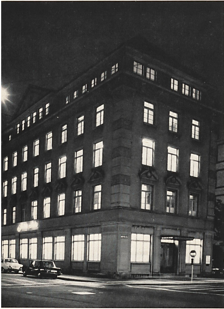
Sucursal en Zurich

para seda, y la Casa Stehli instaló sus primeros 24 telares movidos por una máquina de vapor de 10 CV. La mecanización fue progresando constantemente y suplantó rápidamente el antiguo sistema de tejedura a domicilio. Al lado de los nuevos telares, fueron instalados algunos años después, en 1879, los telares jacquard.