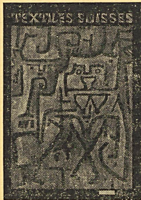
NUESTRA PORTADA Véase página 117