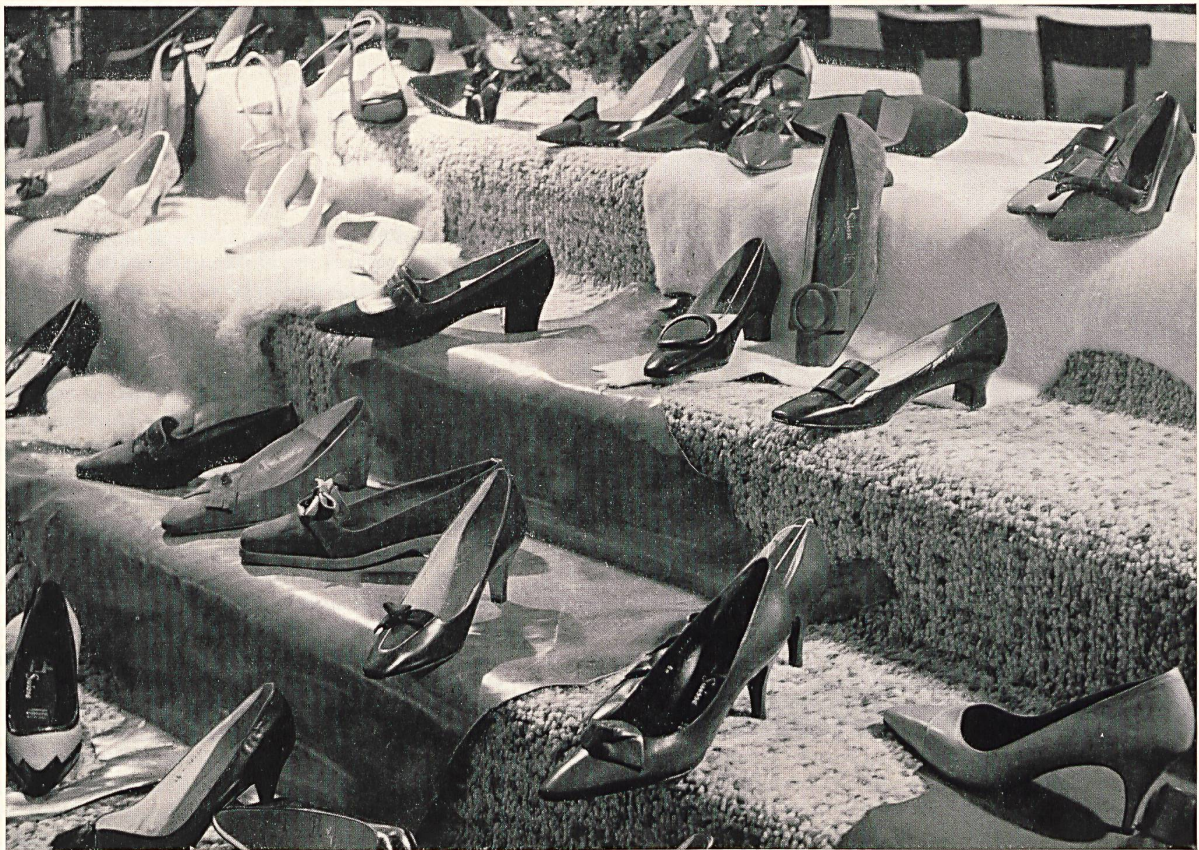
Modèles BALLY déposés

Vista parcial de la rica exposición de calzados Bally presentada a los participantes en un ambiente « lanudo »