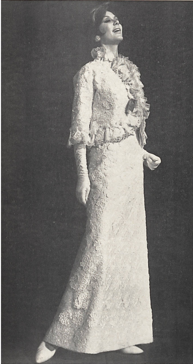
FORSTER WILLI & CO. SAINT-GALL Broderie avec applications sur organza de soie blanc Embroidered white silk organza with appliqué-work Modèle Michael Novarese, Los Angeles

Al cambiar la temporada, cambia la decoración