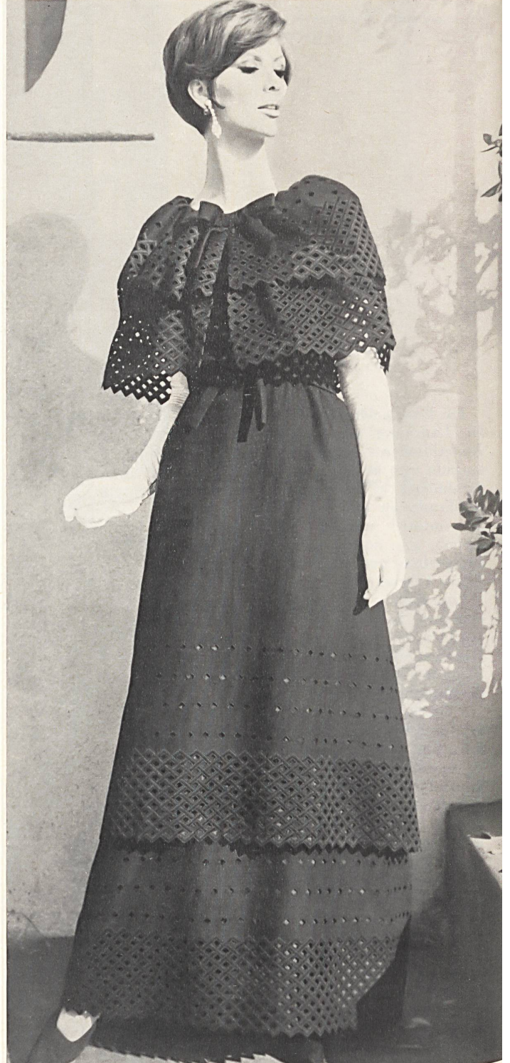
FORSTER WILLI & CO., SAINT-GALL Bordure brodée dans le nouveau style géométrique Embroidered edgings in the new geometrical style Modèle Michael Novarese, Los Angeles