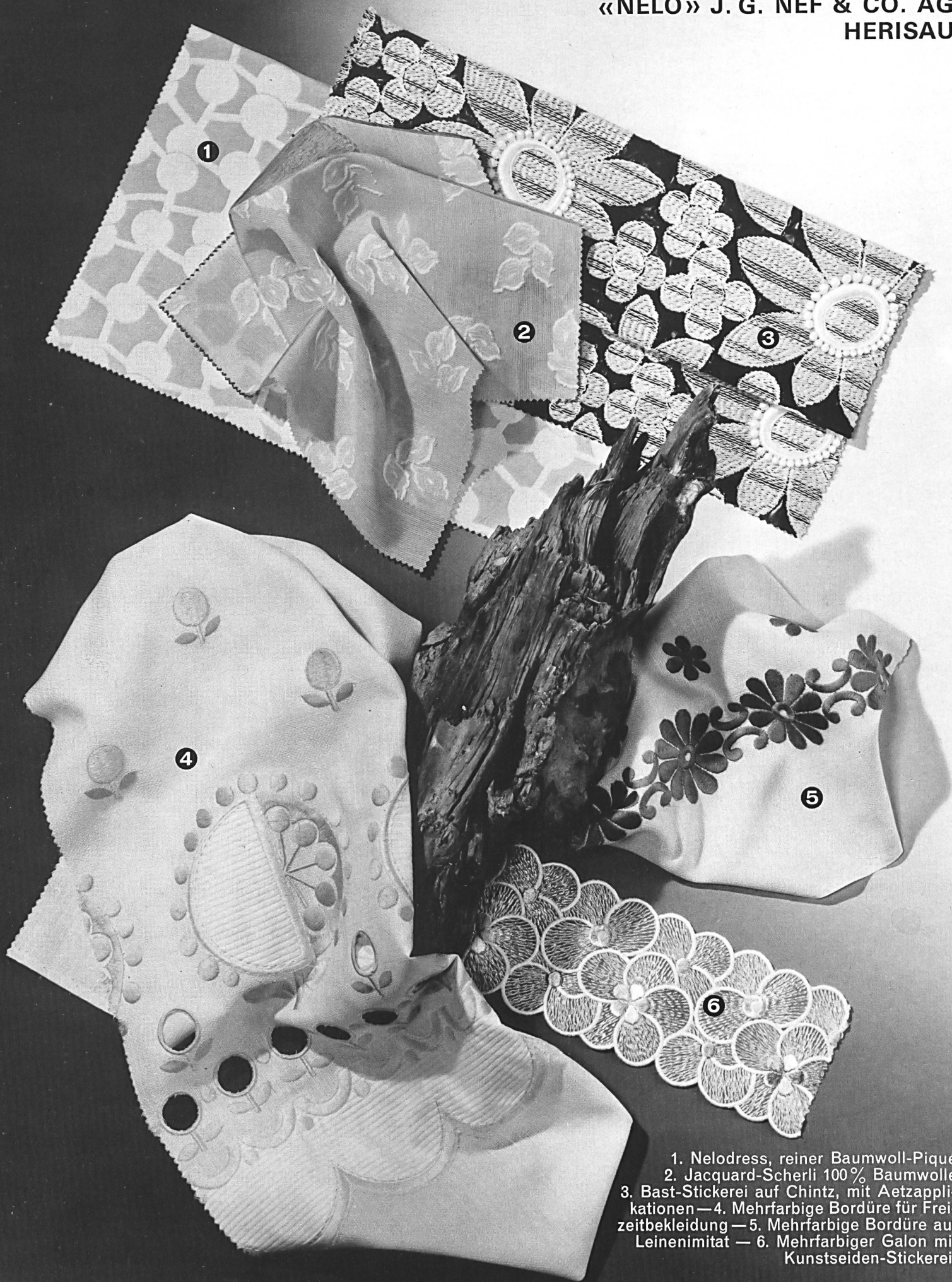
1. Nelodress, reiner Baumwoll-Piqué 2. Jacquard-Scherli 100% Baumwolle 3. Bast-Stickerei auf Chintz, mit Aetzappli- kationen — 4. Mehrfarbige Bordüre für Frei- zeitbekleidung — 5. Mehrfarbige Bordüre auf Leinenimitat — 6. Mehrfarbiger Galon mit Kunstseiden-Stickerei.