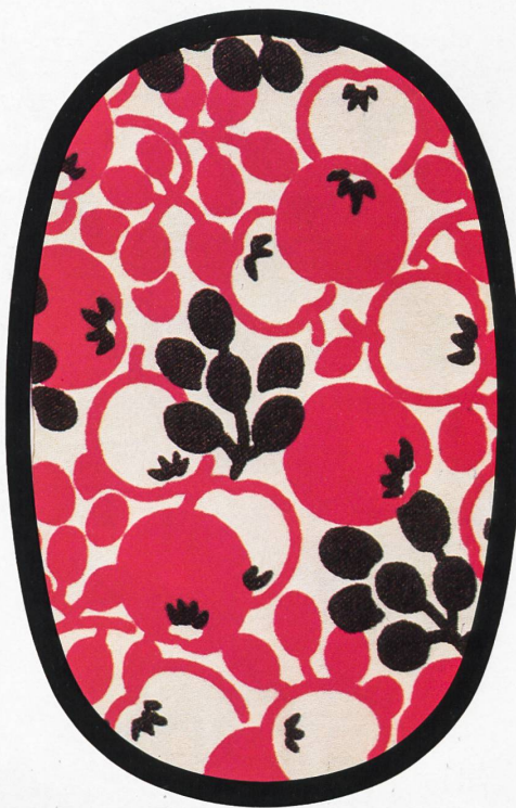
Abraham ● Dior