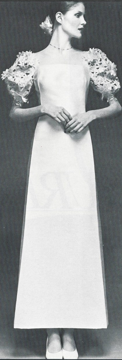
A. NAEF SA, FLAWIL ▲ Broderie découpée avec superposés. Spachtelstickerei mit Superposé-Effekten. Cut-out embroidery with superimposed.