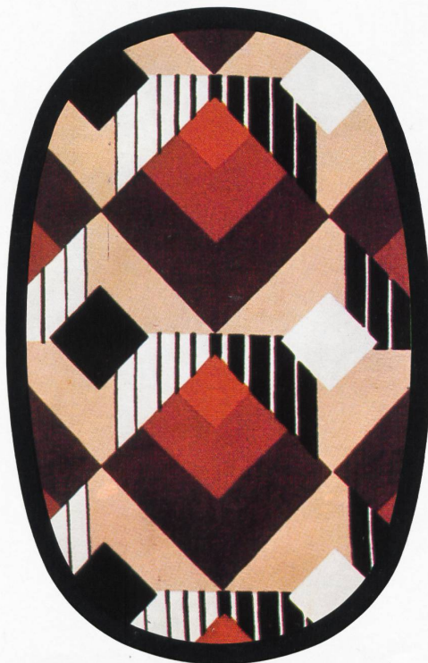
Schwarzenbach ● Féraud