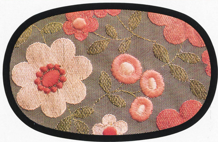
Union ● Carven