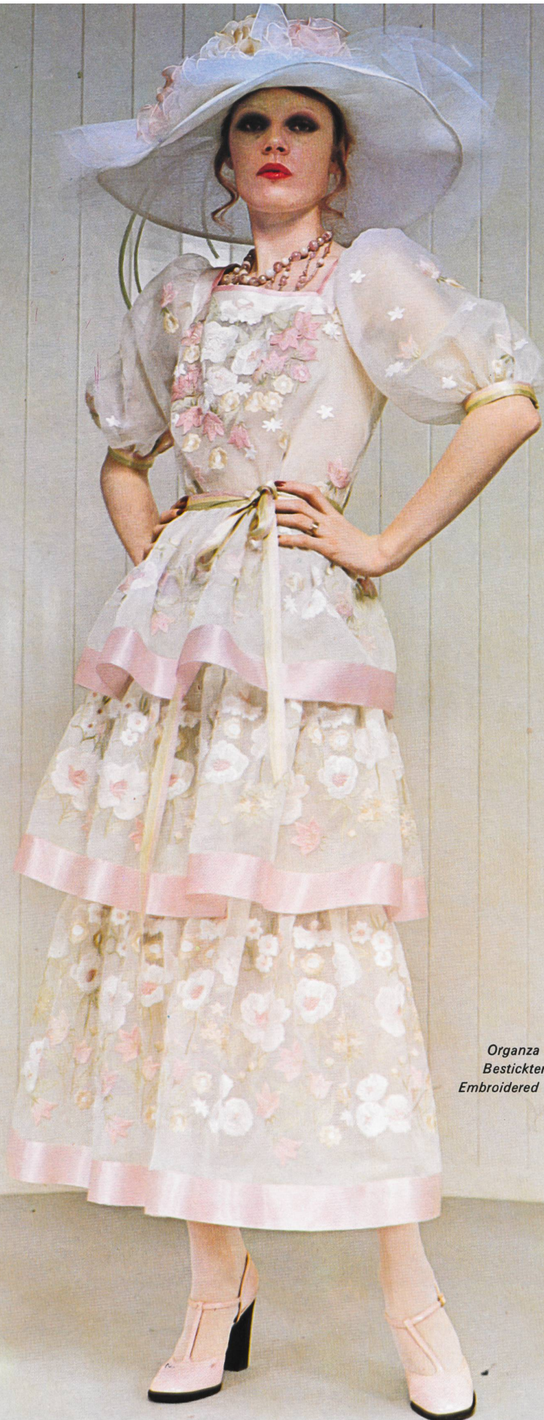
FORSTER WILLI, SAINT-GALL Organza de soie brodé et garni de rubans en satin. Bestickter Seidenorganza, mit Satinbändern verziert. Embroidered silk organza, decorated with satin ribbons.