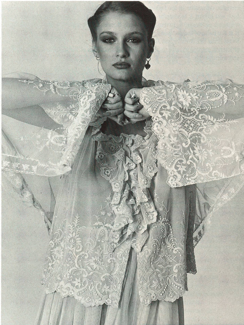
JAKOB SCHLAEPFER + CO. AG, ST. GALLEN Ecrú-coloured cotton embroidery on beige tulle. Ecrúfarbige Baumwollstickerei auf beige Tüll. (Lapidus)

● Im vergangenen November wurden an einem Galaabend im Hyde Park Hotel, London, zwei führende Schweizer Textilfirmen mit dem Grand Prix «Triomphe 1977» de l'Excellence Européenne ausgezeichnet: Mettler + Co. AG und Jakob Schlaepfer + Co. AG , St. Gallen. Diese Auszeichnung wird jedes Jahr an europäische Firmen verliehen, die hochstehende industrielle Leistungen erbringen, welche den guten Ruf europäischer Produkte weltweit verbreiten und deren Prestige auf oberstem Niveau halten. Der Präsident des Comité de l'Excellence Européenne, Serge Vaissière,