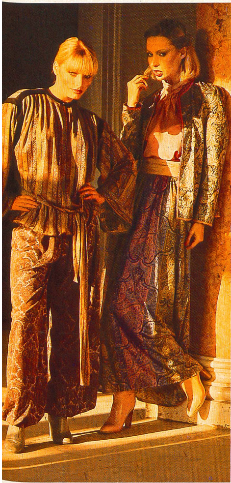
◀ Left: "Amiata" cotton jersey print with Persian design. Right: "Amiata" cotton jersey print, combined with "Cocktail" cotton jacquard.

Links: bedruckter Baumwolljersey «Amiata» mit persischem Dessin. Rechts: bedruckter Baumwolljersey «Amiata», kombiniert mit Baumwolljacquard «Cocktail».