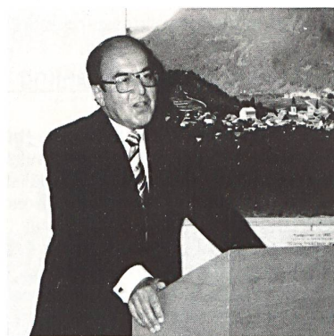
Bundesrat Dr. Kurt Furgler, Vorsteher des Eidg. Volkswirtschaftsdepartementes