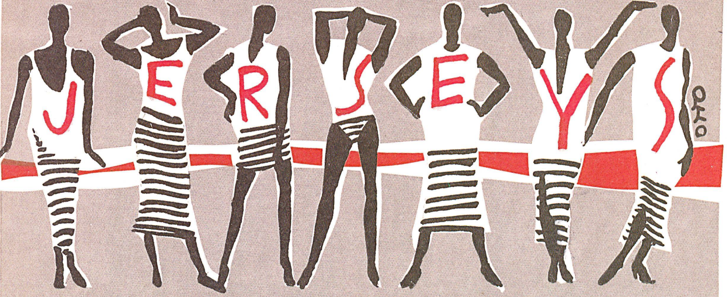
FORSTER WILLI ST-GALL