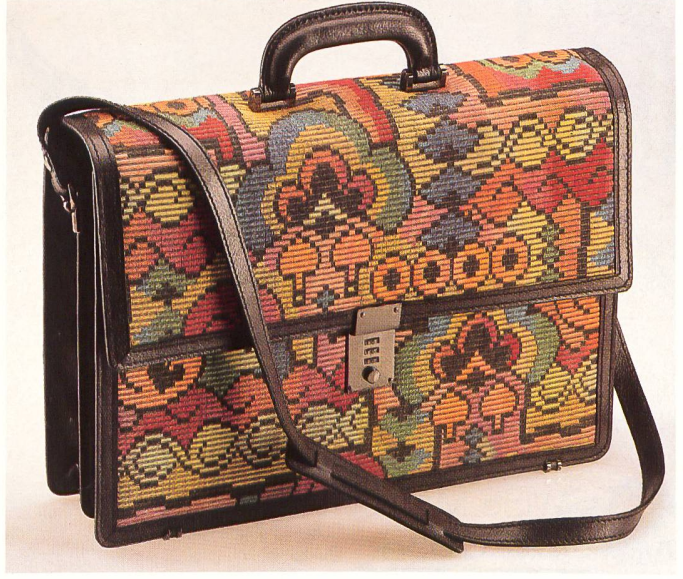
Aktenmappe mit Schulterriemen