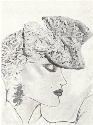
Titelbildgestaltung von Ursula Rodel mit Stoffen von Bischoff Textil AG, St. Gallen