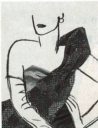
Titelbildgestaltung von Mouchy mit Stoffen von Schubiger+ Schwarzenbach