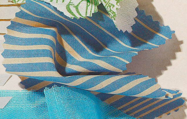
Eugster + Huber