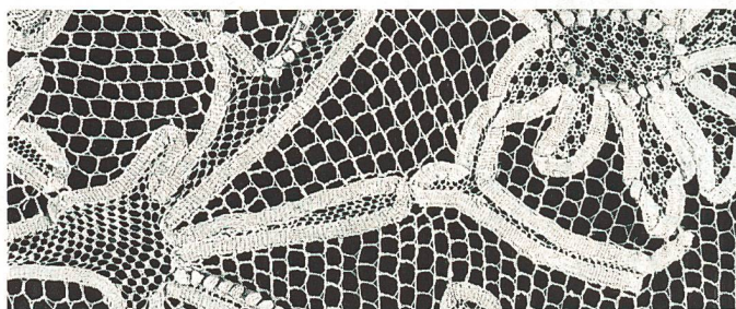
Bandspitze aus dem 18. Jahrhundert

Um diese Bandspitzen gruppieren sich die sehr kostbaren Bänder aus Köln und Florenz des 15. Jahrhunderts die Liturgische Gewänder zierte. Dazu gibt es Brettchen- und Gittergewebe, deren Anwendung an einem spätantiken Tunikafragment ermittelt werden kann. Es wird das Thema der Basler Seidenbandproduktion und der Aargauer Strohindustrie beleuchtet; Posamenterieborten, die früher selbstverständlich jede Fensterverkleidung zierte, werden in ihrer unglaublichen Vielfalt in unsere Erinnerungen zurückgeholt.