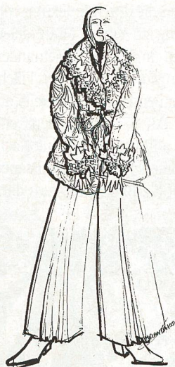
Interstoff Trendmodelle von Konplott Design

Besonders geglückt waren die sportlich interpretierten Gruppen mit Kleiderrocken und Jacken aus Tweedstoffen, Jumpsuits, losen