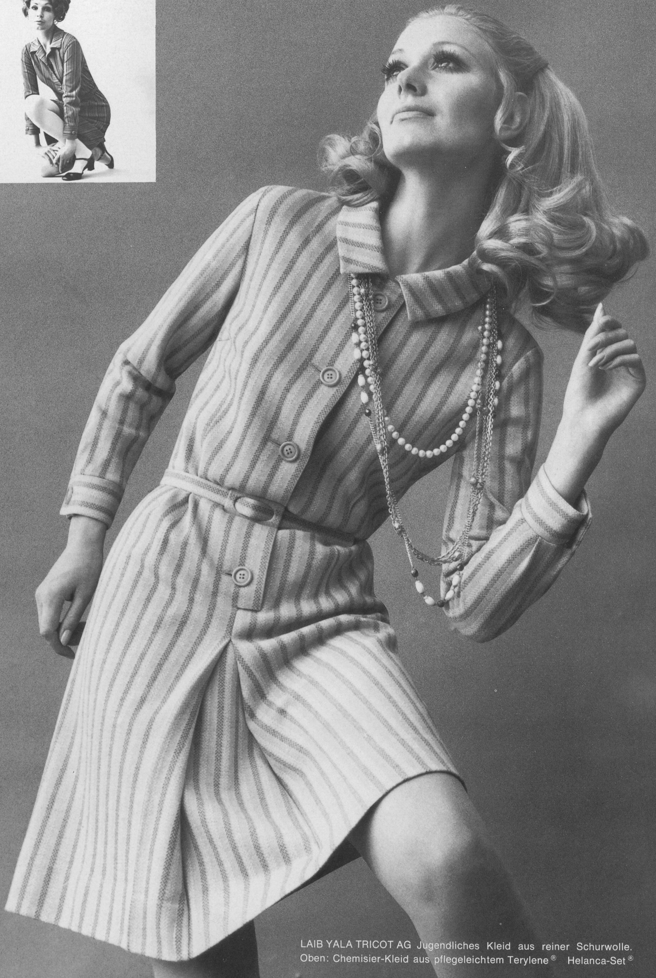
LAIB YALA TRICOT AG Jugendliches Kleid aus reiner Schurwolle. Oben: Chemisier-Kleid aus pflegeleichtem Terylene® Helanca-Set®