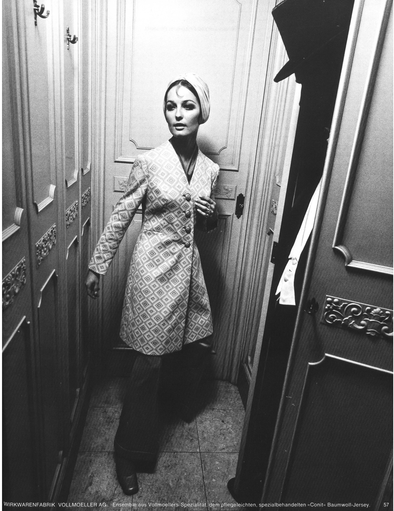
WIRKWARENFABRIK VOLLMOELLER AG Ensemble aus Vollmoellers Spezialität, dem pflegeleichten, spezialbehandelten «Conit» Baumwoll-Jersey.