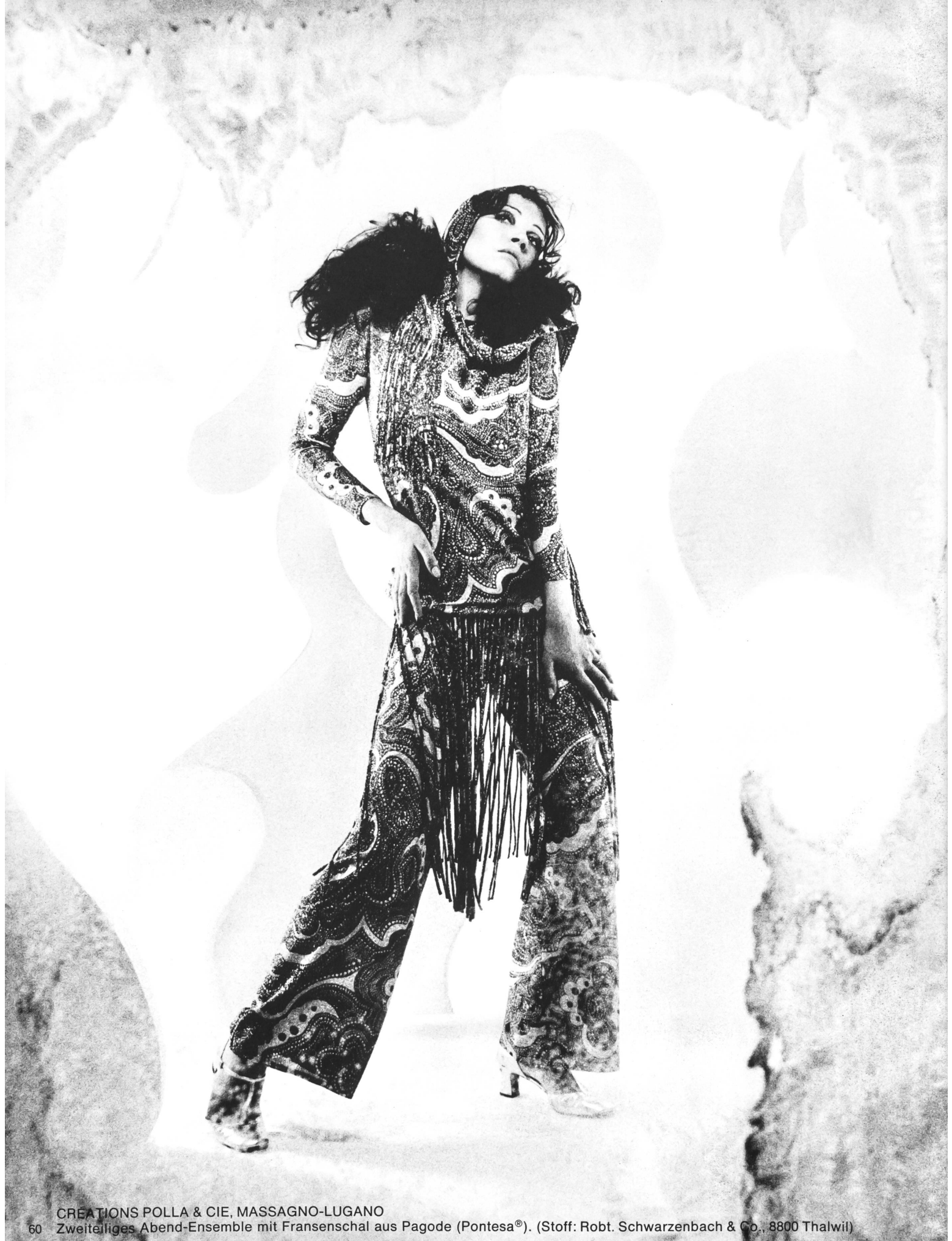
60 CREATIONS POLLA & CIE, MASSAGNO-LUGANO Zweiteiliges Abend-Ensemble mit Fransenschal aus Pagode (Pontesa®). (Stoff: Robt. Schwarzenbach & Co., 8800 Thalwil)