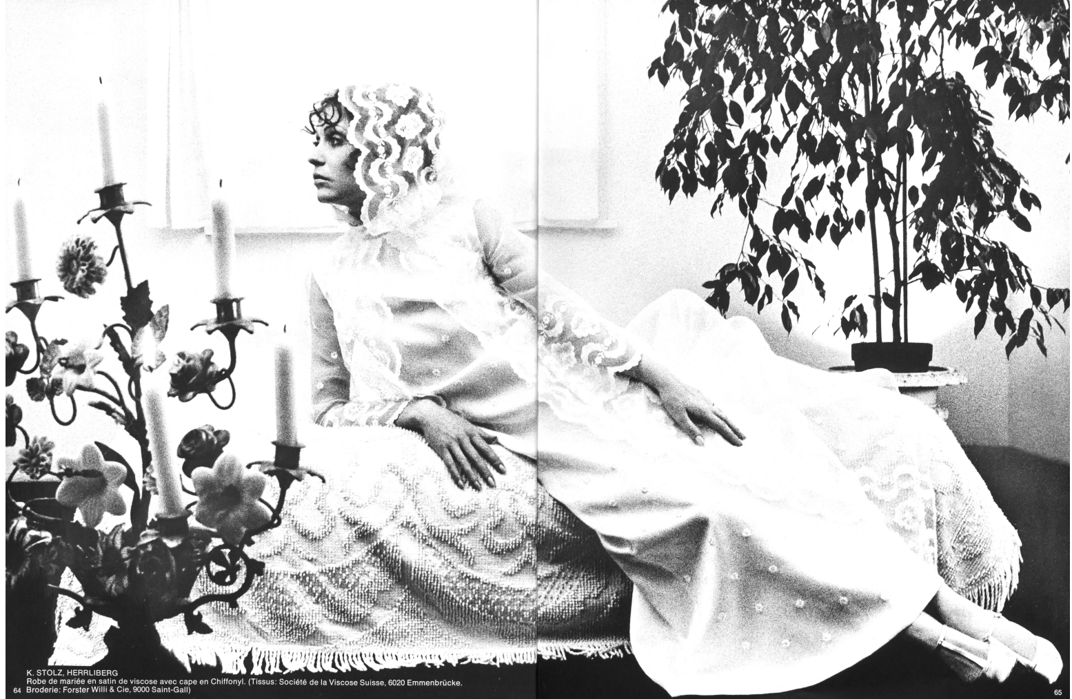
K. STOLZ, HERRLIBERG Robe de mariée en satin de viscose avec cape en Chiffonyl. (Tissus: Société de la Viscose Suisse, 6020 Emmenbrücke. 64 Broderie: Forster Willi & Cie, 9000 Saint-Gall)