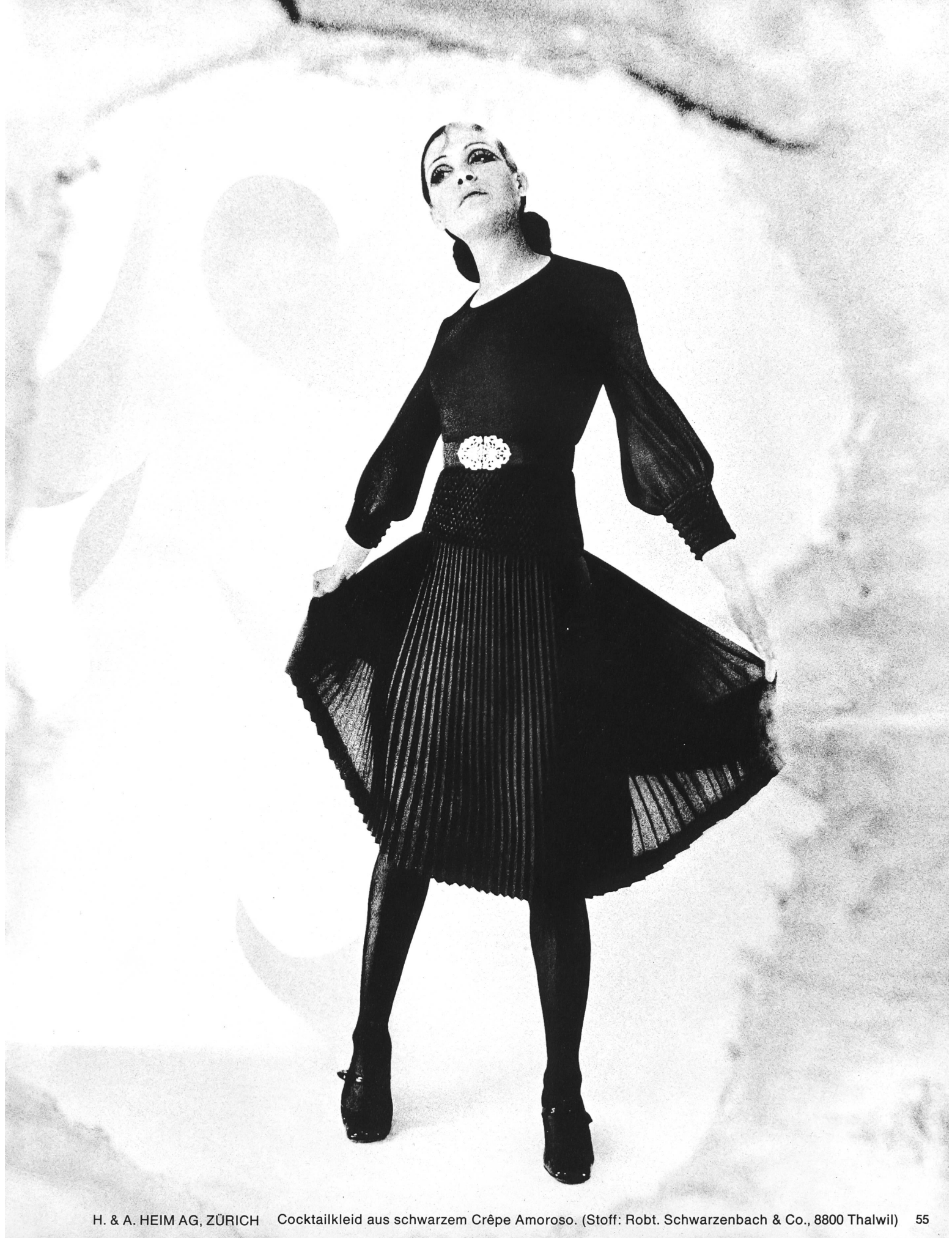
H. & A. HEIM AG, ZÜRICH Cocktailkleid aus schwarzem Crêpe Amoroso. (Stoff: Robt. Schwarzenbach & Co., 8800 Thalwil) 55