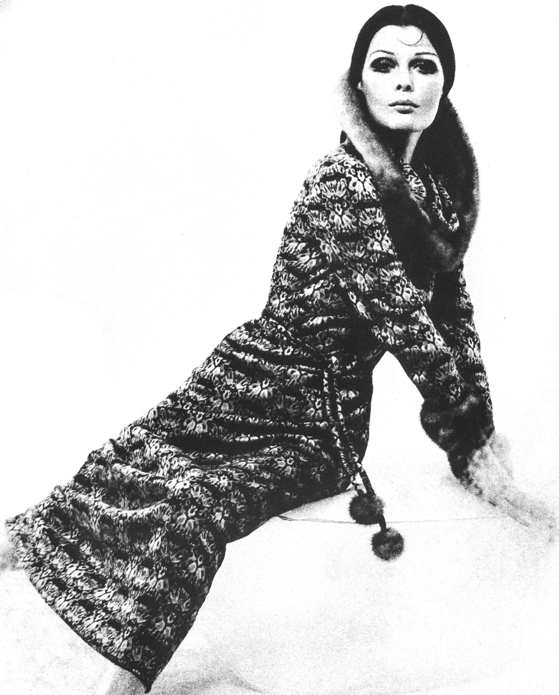
EL-EL AG, ZÜRICH Raffinierter Après-Ski-Anzug in Maxi-Länge, aus reinwollenem Jacquard-Trikot, mit doppelt gerolltem, drapiertem Kragen. (Stoff: Guggenheim Einstein Söhne & Co., 8000 Zürich) 63