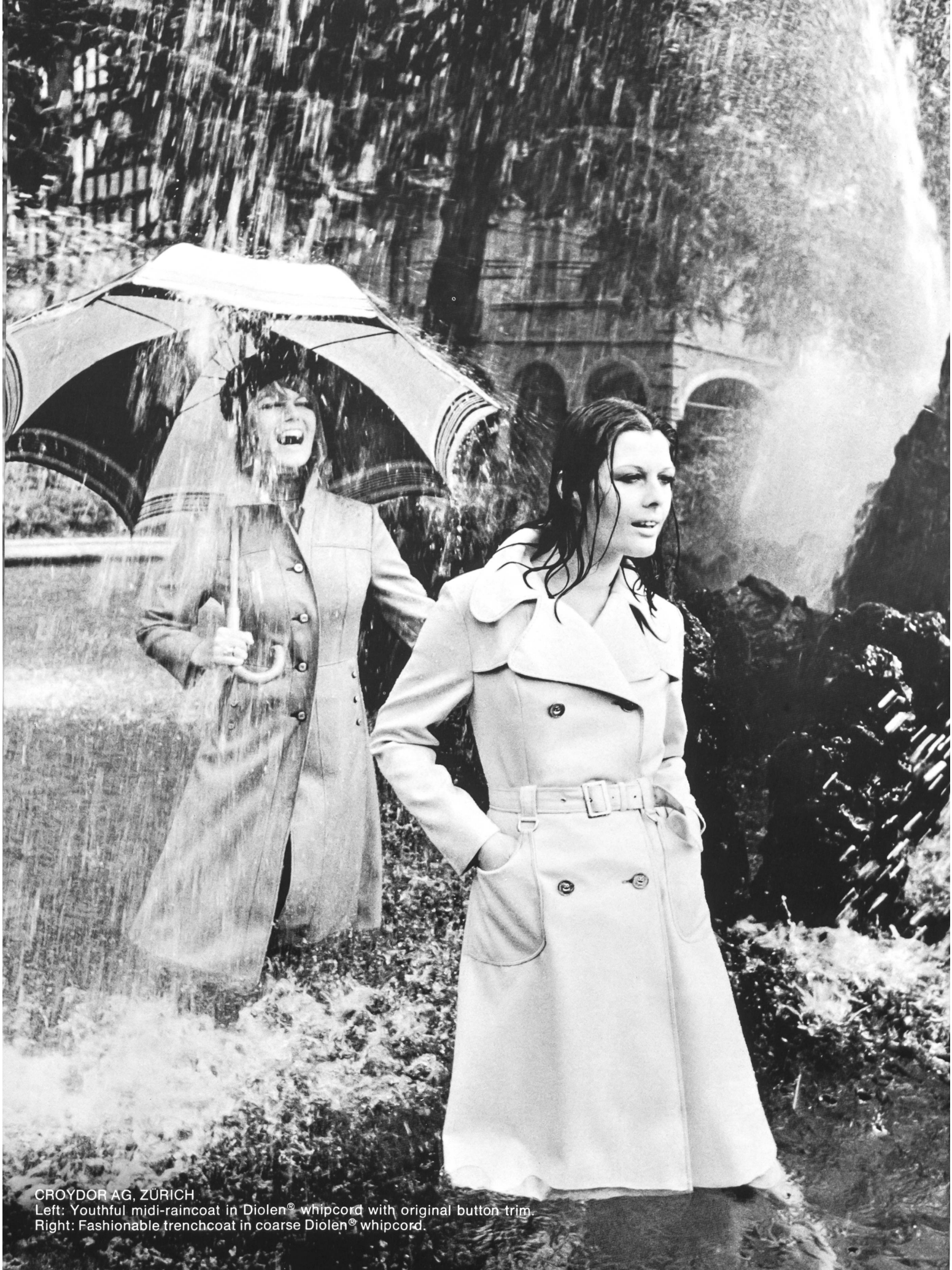
CROYDOR AG, ZÜRICH Left: Youthful midi-raincoat in Diolen® whipcord with original button trim. Right: Fashionable trenchcoat in coarse Diolen® whipcord.