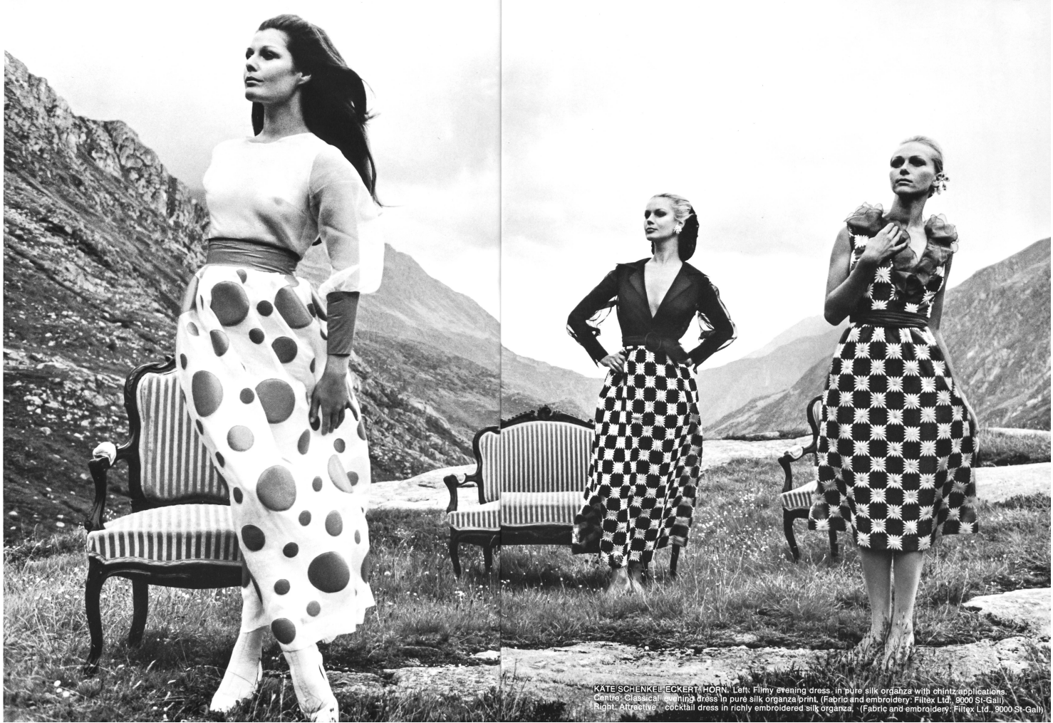
KATE SCHENKEL ECKERT HORN. Left: Flimsy evening dress, in pure silk organza with chintz applications. Centre: Classical evening dress in pure silk organza print. (Fabric and embroidery: Filtext Ltd., 9000 St-Gall) Right: Attractive cocktail dress in richly embroidered silk organza. (Fabric and embroidery: Filtext Ltd., 9000 St-Gall)