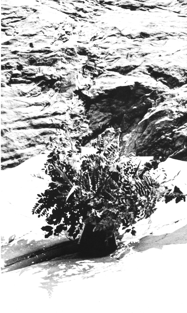
EL-EL AG, ZÜRICH A gauche: Ensemble de gardenparty en satin imprimé Sunion. (Tissu: Mettler & Cie S.A., 9000 Saint-Gall) A droite: Élégant pyjama habillé en satin façonné Flavia imprimé. (Tissu: Christian Fischbacher Co., 9000 Saint-Gall)