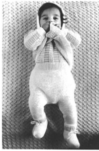
Seite /Page 75

Bébé-Garnitur aus 100% Orlon® in modischer Farbkombination.