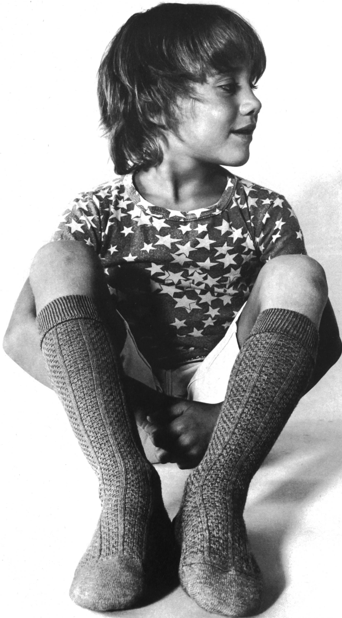
RIME S.A., LAUSANNE Fashionable children's half-stockings in Orlon®