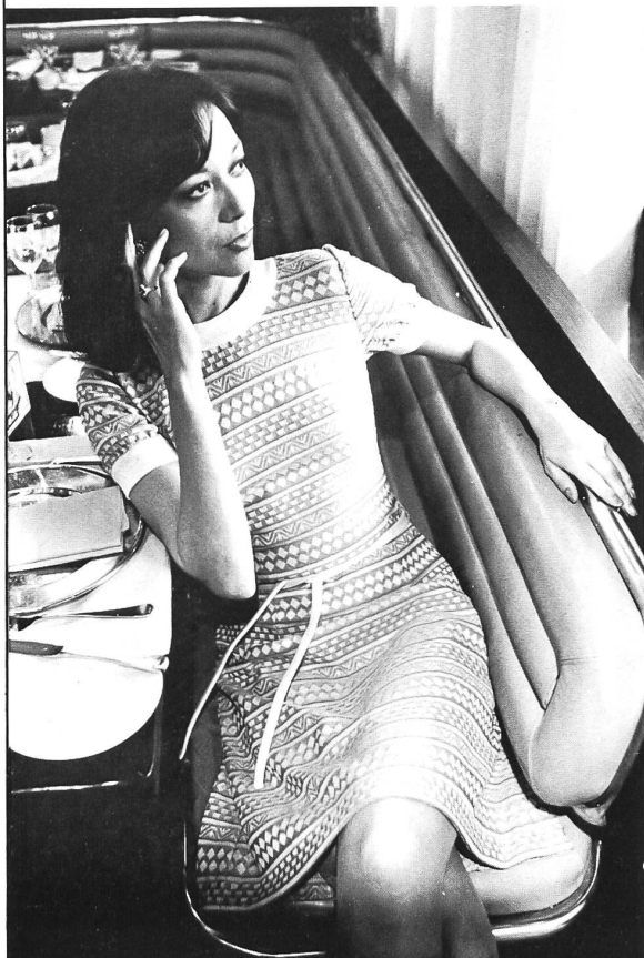
KNECHTLI & CIE AG, SWISS KNITTING CO., ZOLLIKOFEN-BERN Gepflegtes Jacquard-Kleid in aufgelockertem Streifendessin aus 100% Schapira®.