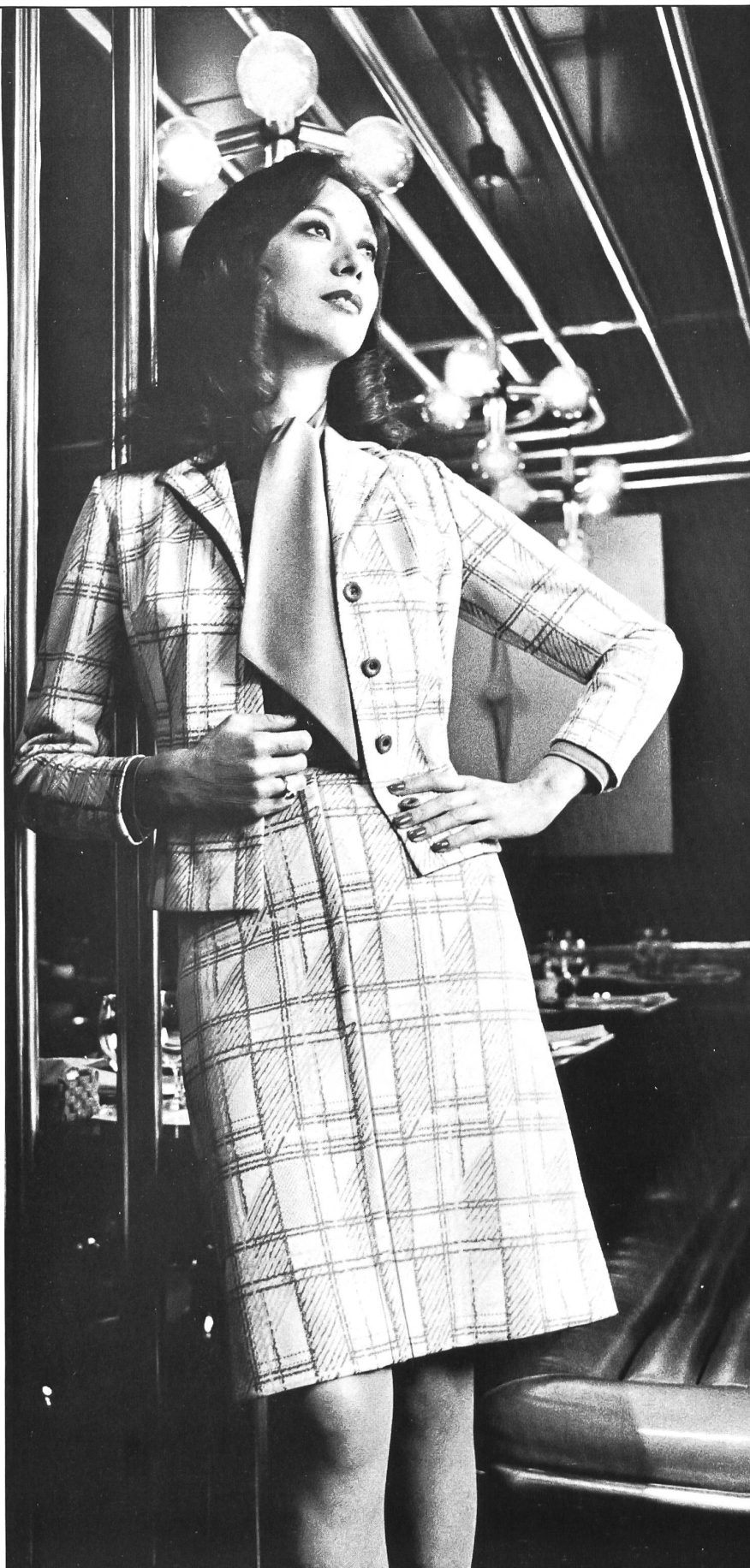
KNECHTLI & CIE AG, SWISS KNITTING CO., ZOLLIKOFEN-BERN Jacquard-Deux-Pièces im Chanel-Stil mit passender Uni-Bluse. Das verwendete Material ist Polyester/Baumwolle.