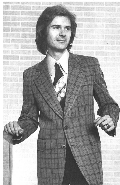
PKZ BURGER-KEHL & CO. AG, ZÜRICH

«Funktionsgerechte Bekleidung für dynamische Männer» war das Thema der diesjährigen, für Modejournalistinnen bestimmten Pressefahrt des Gesamtverbandes der Schweizerischen Bekleidungsindustrie, die Ende Januar stattfand. Im Vordergrund stand dabei der sich – allerdings nach einer eher langen Anlaufzeit – einer zunehmenden Beliebtheit erfreuende Herrenjersey. In der Meinung, dass sich Modejournalistinnen nicht nur mit den neuesten Modetendenzen, sondern unter anderem auch mit verkaufshemmenden und herstellungstechnischen Problemen der Bekleidungsindustrie auseinandersetzen müssen, entschied sich der Veranstalter, insbesondere drei Stimmen Gehör zu verschaffen: jener des Psychologen, jener des Herrenkonfektionärs mit eigener Ladenkette und jener des Damenkonfektionärs, der mit Erfolg die Herstellung auch von Herrenjersey aufgenommen hat.