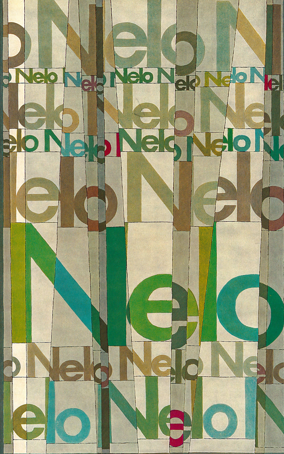
Nelo - The Label of High Class Furnishing Fabrics - J.G.Nef & Co. Ltd. Herisau