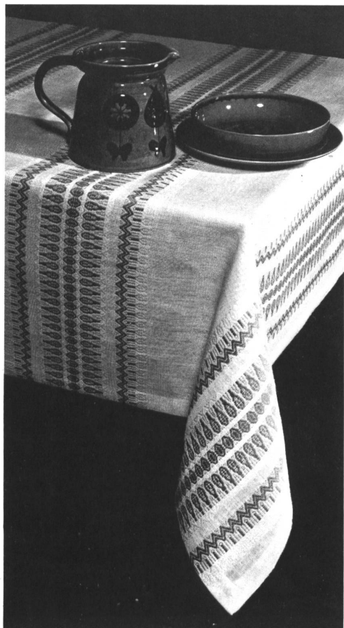
Reinleinen-Tischtücher in Handwebart, einmal echtröh, einmal meliert.

Tapis de table mi-fil, genre tissage main, l'un écru naturel, l'autre en couleurs mélangées.